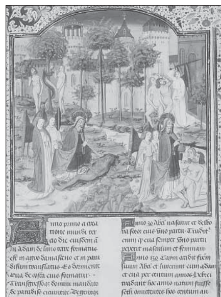
Ilustrace: Komitálje Bibliothek

Toto základní zjevení „Boha — tajemství“ se pro křesťany stalo povzbuzením a výzvou i na rovině umělecké tvorby. Zde má svůj původ rozkvět krásy, který odsud, z tajemství vtělení, čerpal svou mízu. Vždyť Syn Boží tím, že se stal člověkem, vnesl do dějin lidstva veškeré evangelijní bohatství pravdy a dobra a skrze ni odhalil i nový rozměr krásy: evangelijní poselství je jí plné až po okraj.