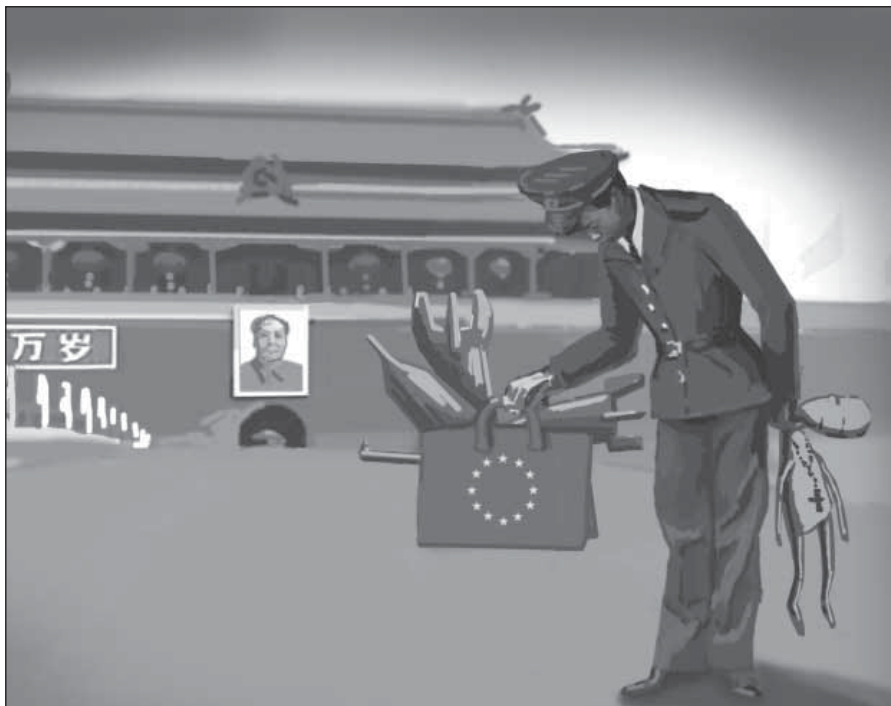
Kresba: Edita Krausová

Jakákoli politická opozice se likviduje již v zárodku — např. za šíření tzv. „Tchien-an-menských dokumentů“, jež líčí rozhodování vládců před masakrem, hrozí trest smrti. Čínské vězeňské tábory Lao-kchai jsou plně srovnatelné s nacistickými koncentráky či sovětským gulagem. Vězni jsou tu nuceni k otročké práci, někdy i zabíjeni. Čínské ženy jsou nuceny k potratům, nepovoleně narozené děti jsou utráceny.