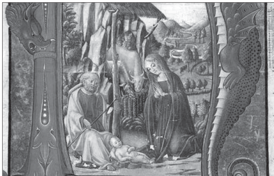
Francesco di Giorgio Martini: Narození Páně

I takové mohou být Vánoce. Přes pestrobarevnou mozaiku vánočních přání, pokud se ze mne — čtenáře vánočních lístků nestane inkvizitor, či cenzor, prosvítá základní motto: Vánoce jsou vždy překvapením. Nad sebemenším i sebevětším dárkem mohu žasnout. Opravdu? Nezasnu spíše nad tím, že odhaluji lásku, přízeň, či přátelství mých nejbliž-