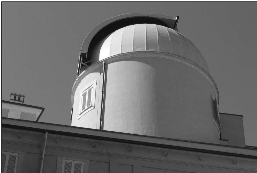
Vatikánská astronomická observatoř

K nové etapě došlo na přelomu 19. a 20. století, kdy se objevila existence jádra, elektronů a dalších složek hmoty, které byly ještě „o patro níž“ než atomy