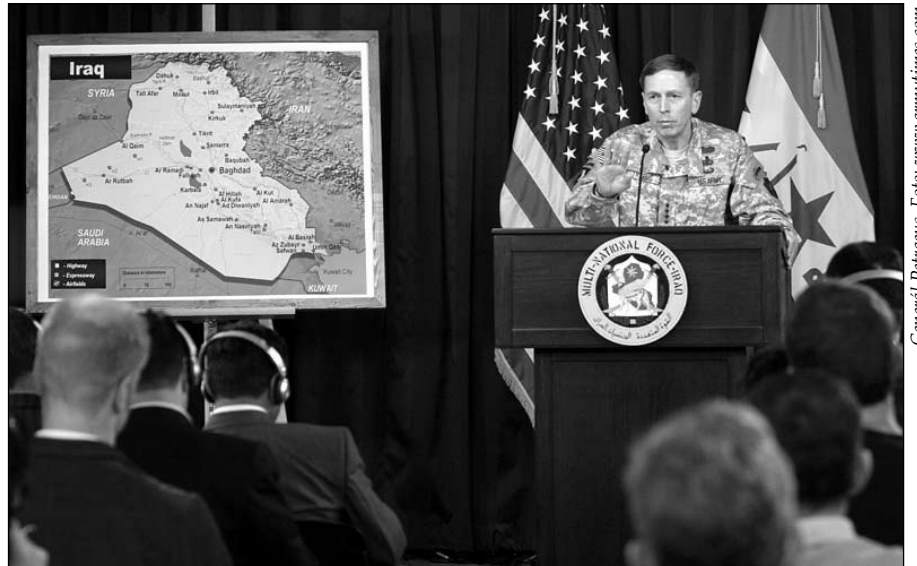
Generál Petraeus.

(B) Nelze dopustit, aby sebevrazi dostali ničivější zbraně, např. chemické, biologické či jaderné. Tyto zbraně však není tak snadné získat; a především, není snadné je získat pro nestátní entity. Pokud by je teroristické organizace získaly, pak nejspíš od režimů, které jsou