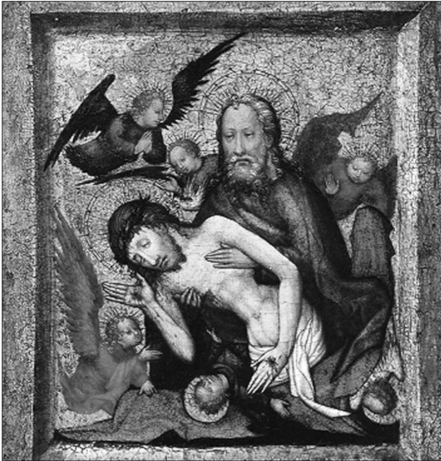
Svatá Trojice Mistra Votivní desky ze St. Lambrecht

turgického i pastoračního. Jestliže koncil zdůraznil na adresu duchovenstva požadavek bratrské spolupráce, nejsou z něho vyňati ani laici.