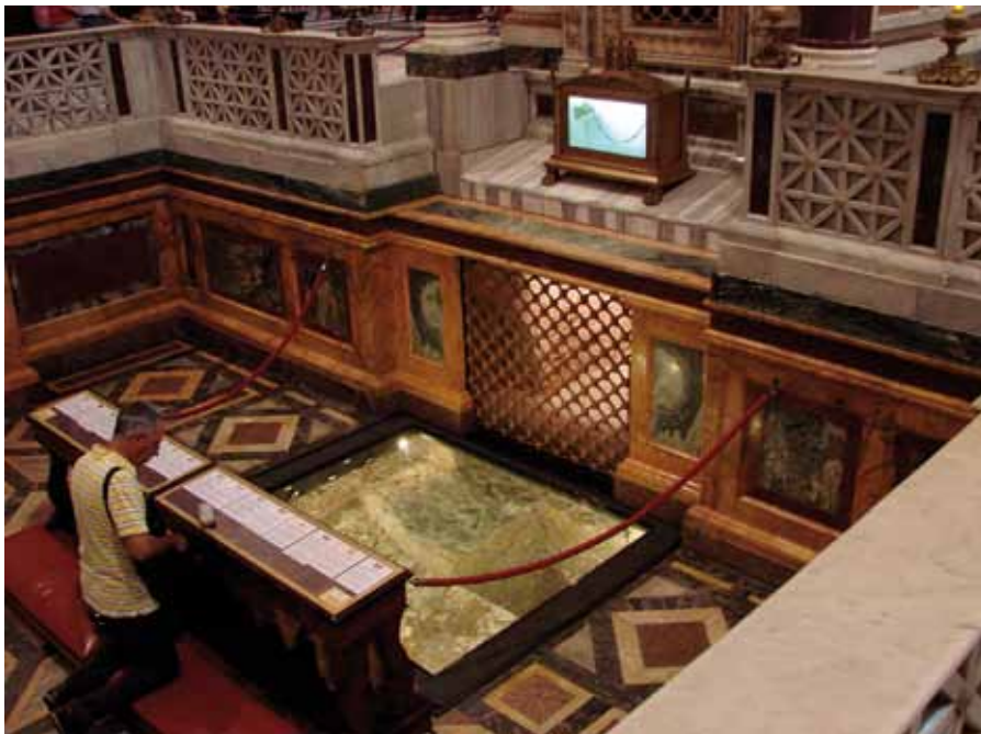
Před hrobem Apoštola národů v bazilice Sv. Pavel za hradbami v Římě

Opat dále řekl, že papež rozpoznal v iniciativě benediktinů příležitost osvětlit dva základní body: především možnost seznámit se lépe se svatým Pavlem, apoštolem, „který má na křesťanskou tradici větší vliv než kdokoli jiný – a poznat Pavla a jeho spisy, to znamená poznat Ježíše Krista“. Za druhé papež viděl tuto oslavu v ekumenické perspektivě. A přiblížení k nekatolickým křesťanům bylo skutečně jedním z hlavních dopadů jubilea. Opat připomněl, že pravoslavný ekumenický patriarcha rovněž vyhlásil rok svatého Pavla, který zhruba odpovídal datu katolických oslav.