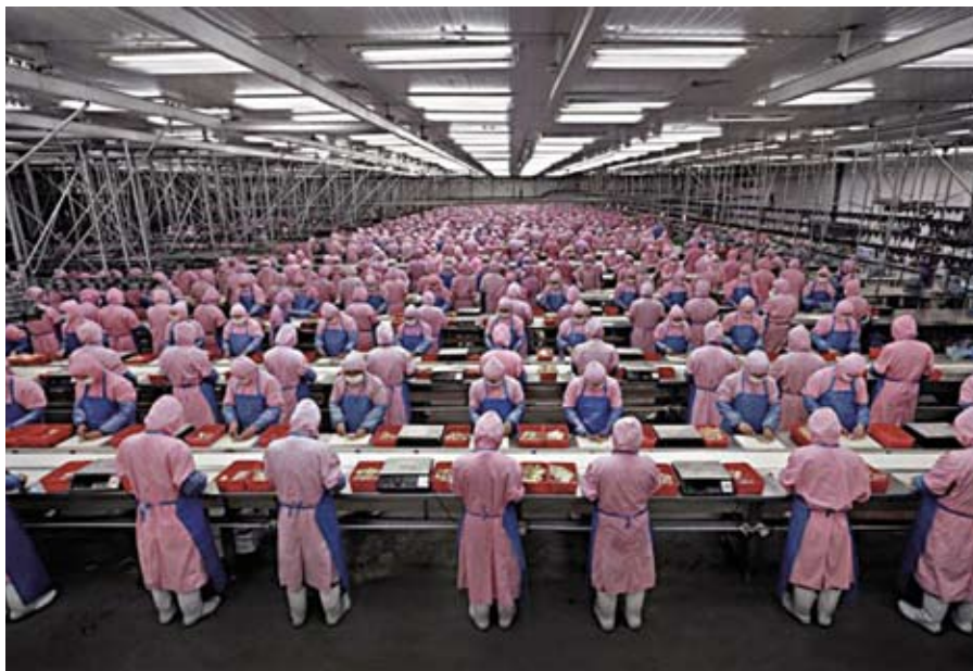
Technika ve službách člověka, nebo člověk v zajetí techniky?

Sociální otázka je otázkou antropologickou