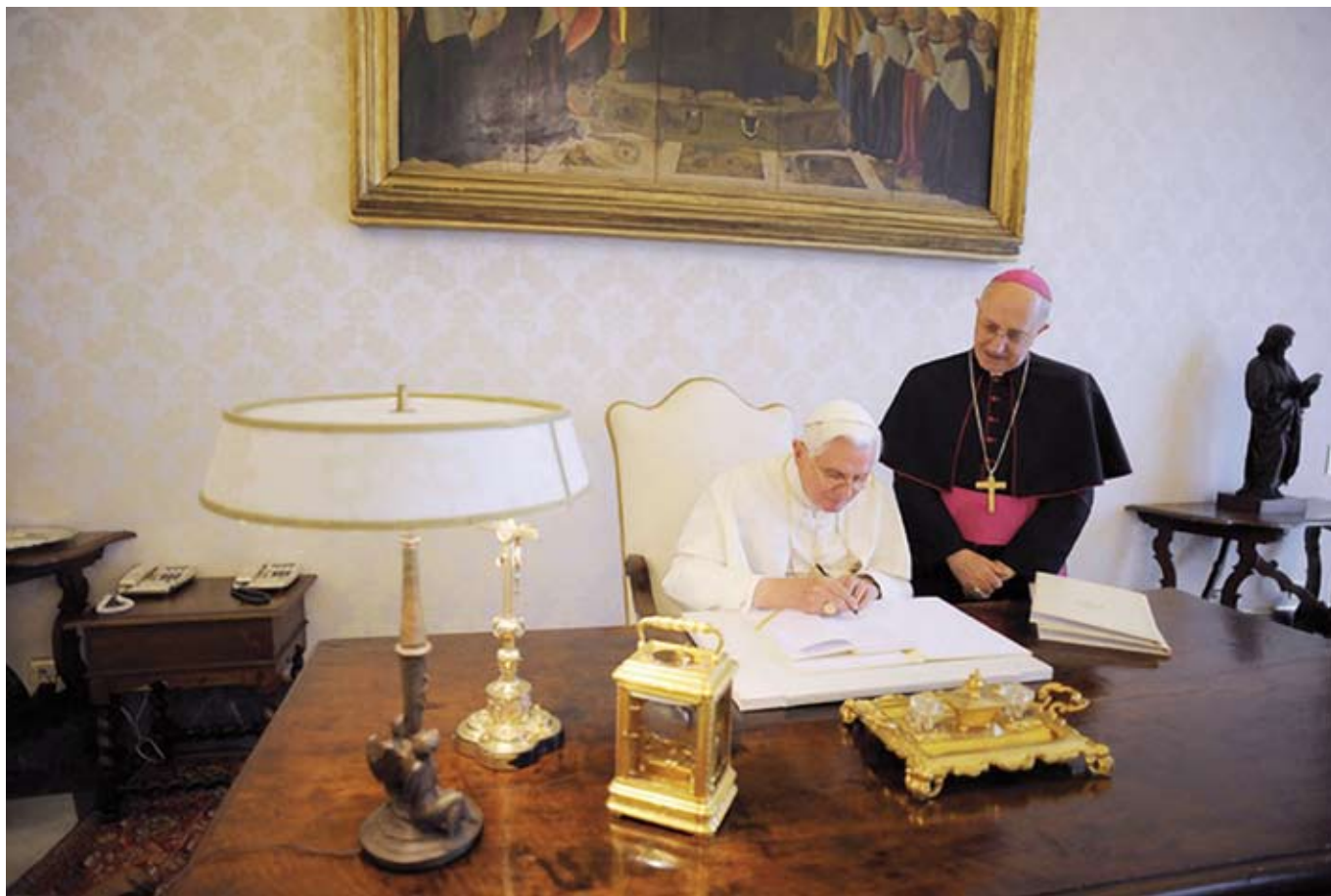
Benedikt XVI. podepisuje svoji třetí encykliku