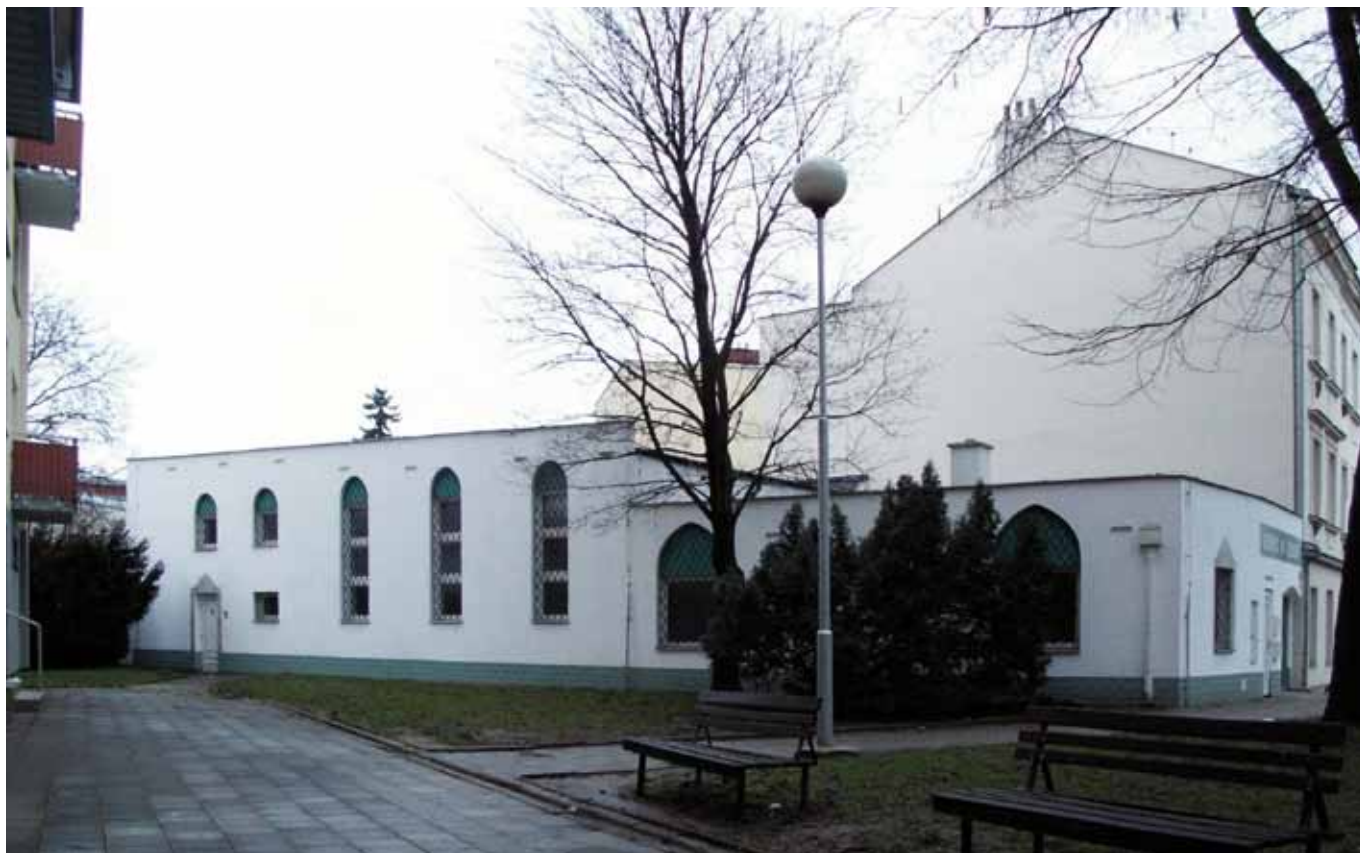
Brněnská mešita, otevřená v červenci 1998