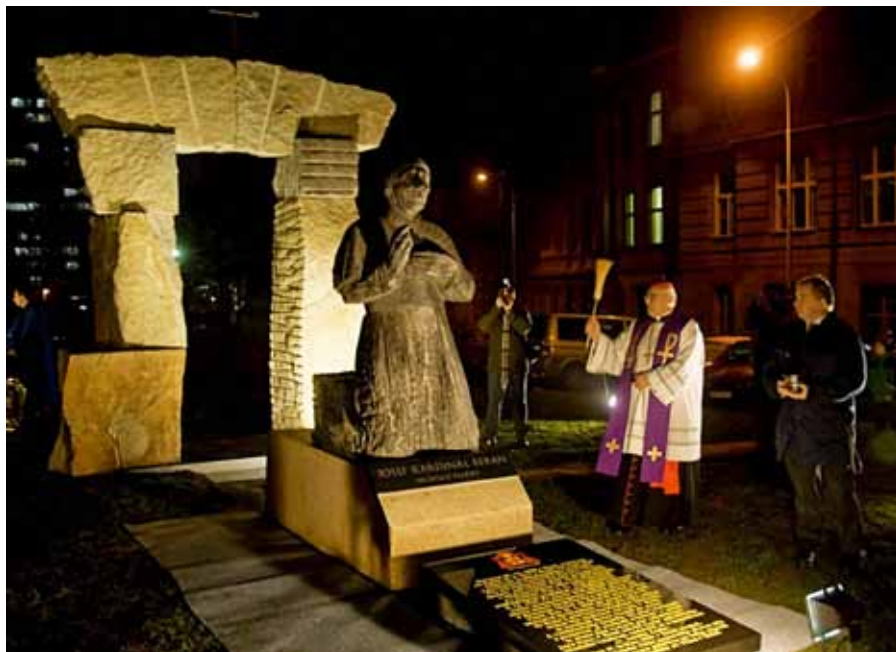
Kardinál Miloslav Vlk zehná pomník kardinála Josefa Berana před Arcibiskupským seminářem v Praze-Dejvicích 7. prosince

Já hlasuji pro zákaz komunistické ideologie. Ne z osobní nenávisti ke komunistům, že mě v minulosti tvrdě poškozovali a pronásledovali – to jsem jim jako křesťan už dávno odpustil – ale proto, že jejich ideologie škodí i dnes přímo nebo nepřímo této společnosti, i když už nemá takovou politickou moc.