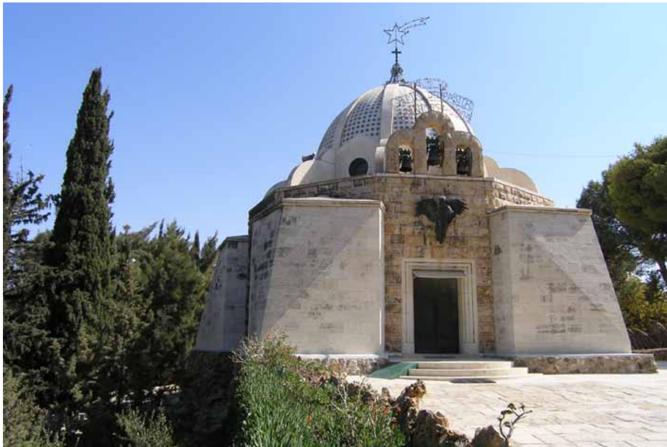
Katolická františkánská kaple Pole pastýřů z roku 1954 na betlémském předměstí