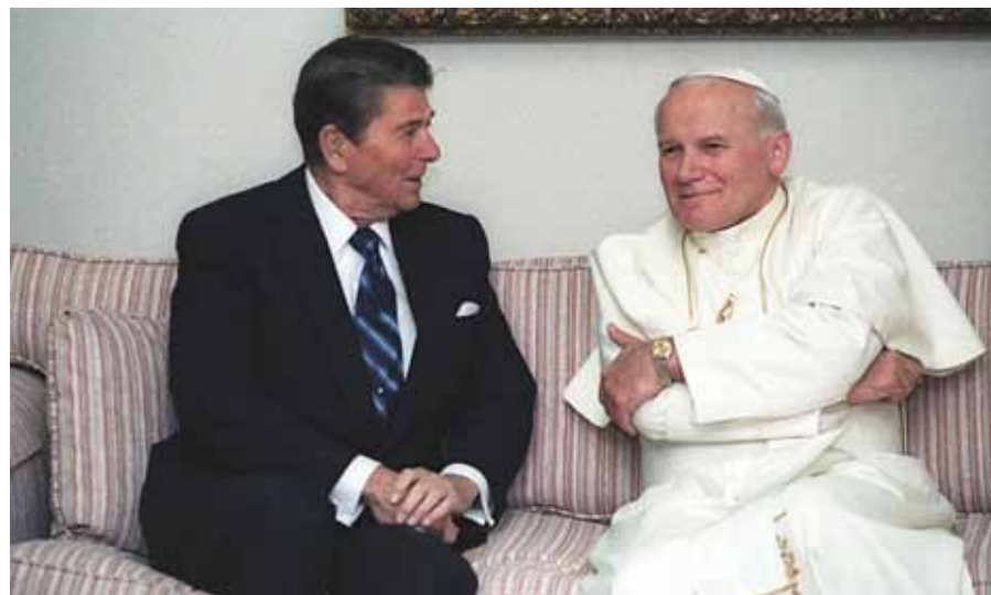
Setkání prezidenta USA Ronalda Reagana s papežem Janem Pavlem II. ve Fairbanksu na Aljašce v roce 1984

...nemůžeme pochybovat o vlivu Jana Pavla II., který daleko přesahoval jakoukoli sekulární postavu své vlasti a rozšířil své působení i do dalších zemí. To on byl katalyzátorem sil, jež se začaly vynořovat už na počátku osmdesátých let.