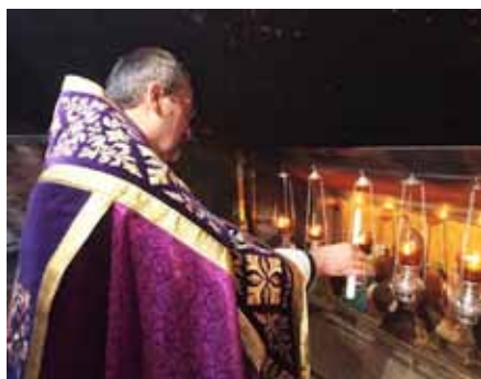
Kustod Svaté země P. Pierbattista Pizzaballa OFM zapaluje svíci v betlémské jeskyni Narození