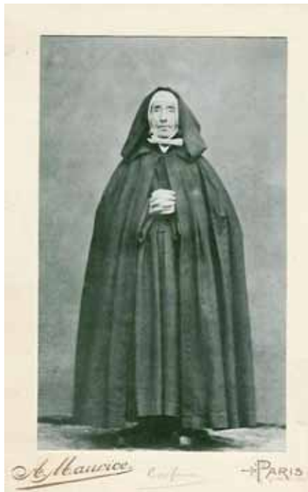
Dobová fotografie Jeanne Juganové

V dnešním evangeliu, v blahoslavenstvích, nám Ježíš připomíná, že všechny naše skutky, které konáme ve prospěch druhých, mají duchovní rozměr. My se podílíme na novém stvoření. Jsme svědky toho, jak je Boží království přítomné