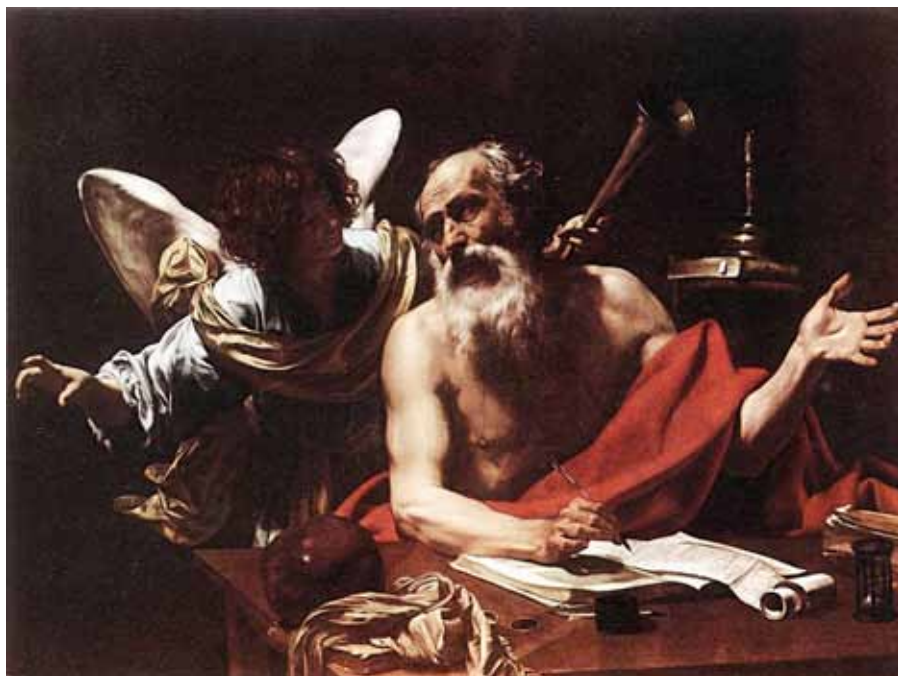
Simon Vouet: Svatý Jeroným a anděl (20. léta 17. stol.)

Benedikt XVI. ke členům Mezinárodní teologické komise