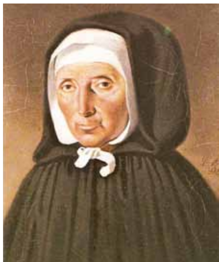
Svatá Marie od Kříže (Jeanne Jugan)

Promluva washingtonského arcibiskupa ke kanonizaci zakladatelky Marie de la Croix