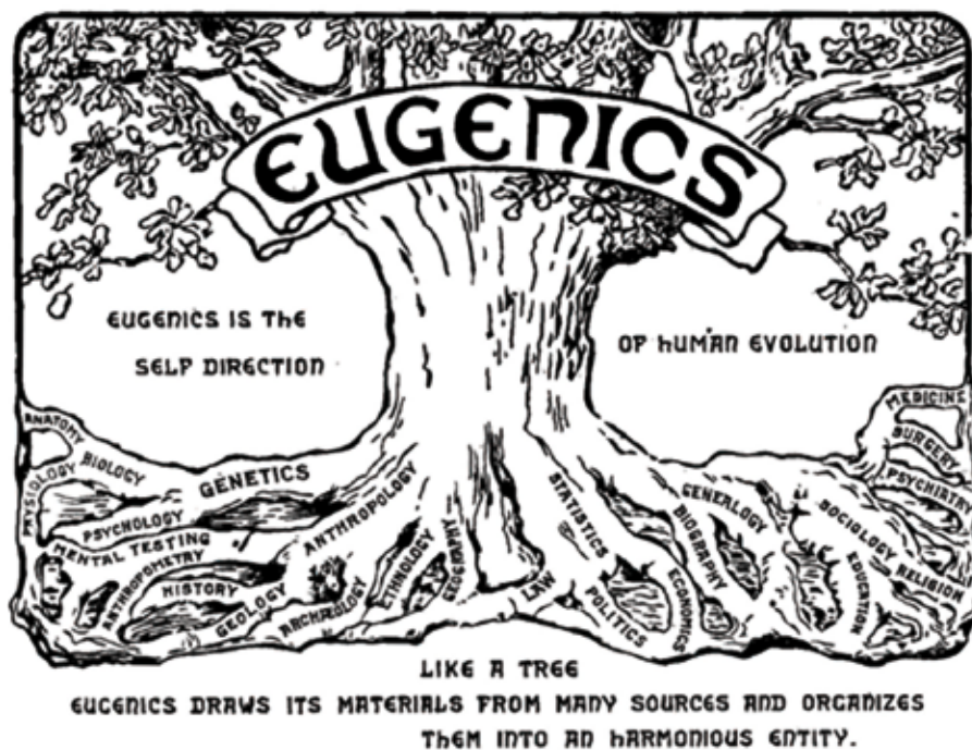
Logo druhého mezinárodního kongresu eugeniky (1921).

Mýlil se Galton, když usiloval o vylepšení lidstva biologickou cestou? Eugenika, pomineme-li její děsivé konotace politického rázu, které stály u jejích základů, byla založena rovněž na dosti sporných až pochybných postulátech z přírodních věd. Při kategorizaci lidí do skupin podle inteligence pracoval s vágními pojmy, jako např. „významnost“ zkoumaných jedinců. Systematicky podceňoval vlivy prostředí a nasbíraná data měla sloužit jen k potvrzení předem určených hypotéz či spíše dojmů Francise Galtona, nikoli k nalezení pravdy. A samozřejmě měly jeho ideje silný politický dopad. Pokud by lidé neplnili určené úkoly dobrovolně, měly být použity donucovací prostředky. Co kdyby se lidé z odlišných prostředí i přes zákaz nepřestali mísit? Co kdyby nechtěli mít účast na společnosti založené na eugenice? Galton nepředpokládal eugeniku s brutalitou nacionálních socialistů, ale donucení blíže neurčenými prostředky se nebránil.