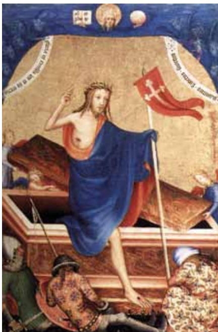
neznámý vlámský malíř: Zmrtvýchvstání (1400)

Kristus žije v nás, proto při každé snaze odevzdat se mu v modlitbě jsme