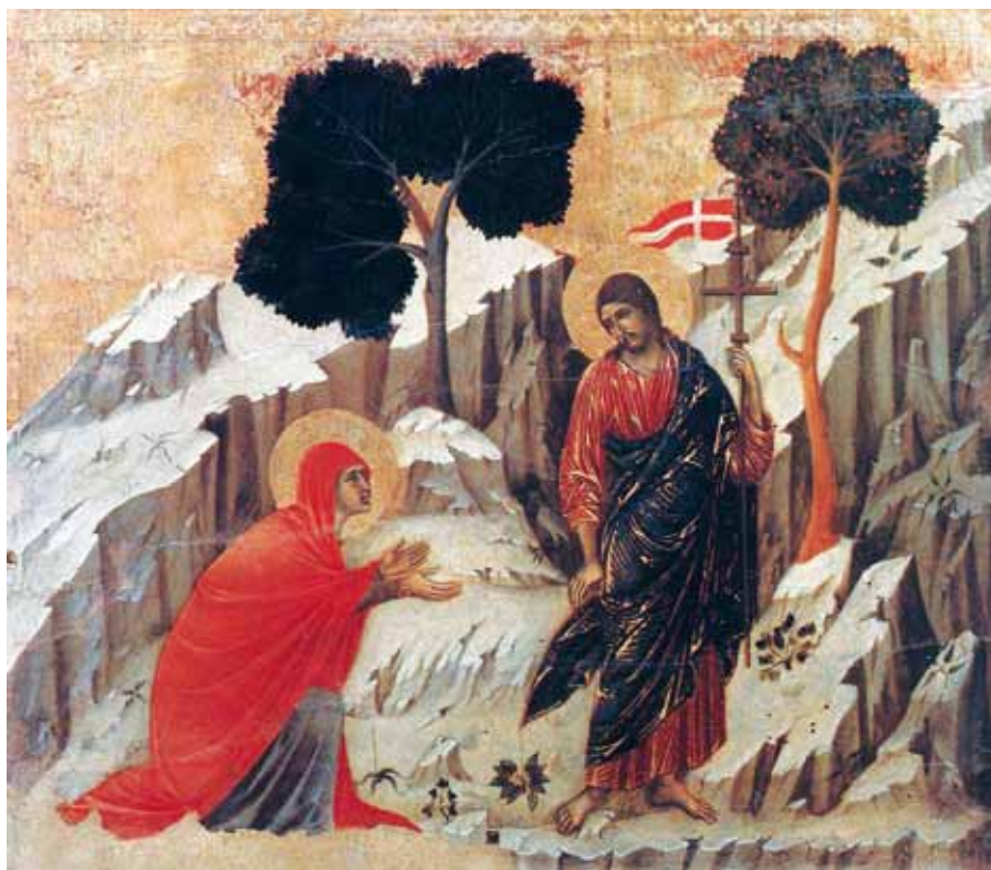
Duccio di Buoninsegna: Setkání s Marií Magdalskou (1308–1311).

Kristus byl pomazán duchovním olejem radosti, to jest Duchem Svatým. Ten se nazývá olejem radosti proto, že on sám je původcem duchovní radosti. A vy jste byli pomazáni skutečnou masťou a dostali jste tak podíl s Kristem a stali se Kristovými druhy.