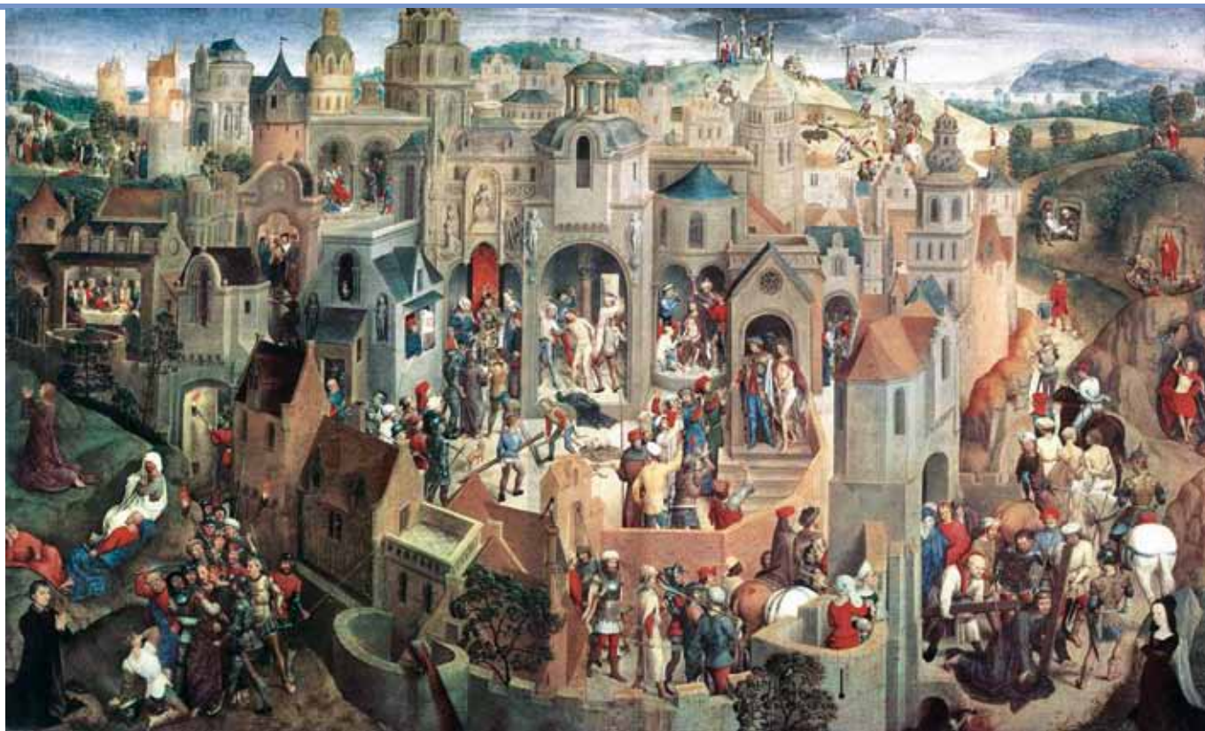
Hans Memling: Scény z Kristových pašíjí (1470–1471).