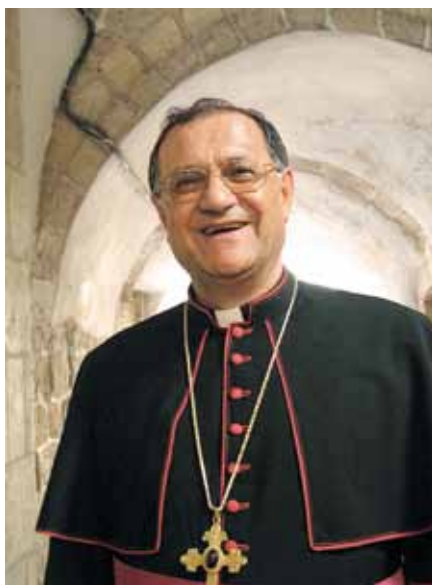
Mons. Fouad Twal.

Je to zvláštní město, krásné město a dramatické město, nad kterým i náš Pán zaplakal. A my stále pláčeme. Není to jednoduché. Jeruzalém spojuje všechny věřící – židy, muslimy, křesťany –, ale zároveň všechny věřící rozděluje – na smrt. Všichni chtějí, aby byl Jeruzalém jejich