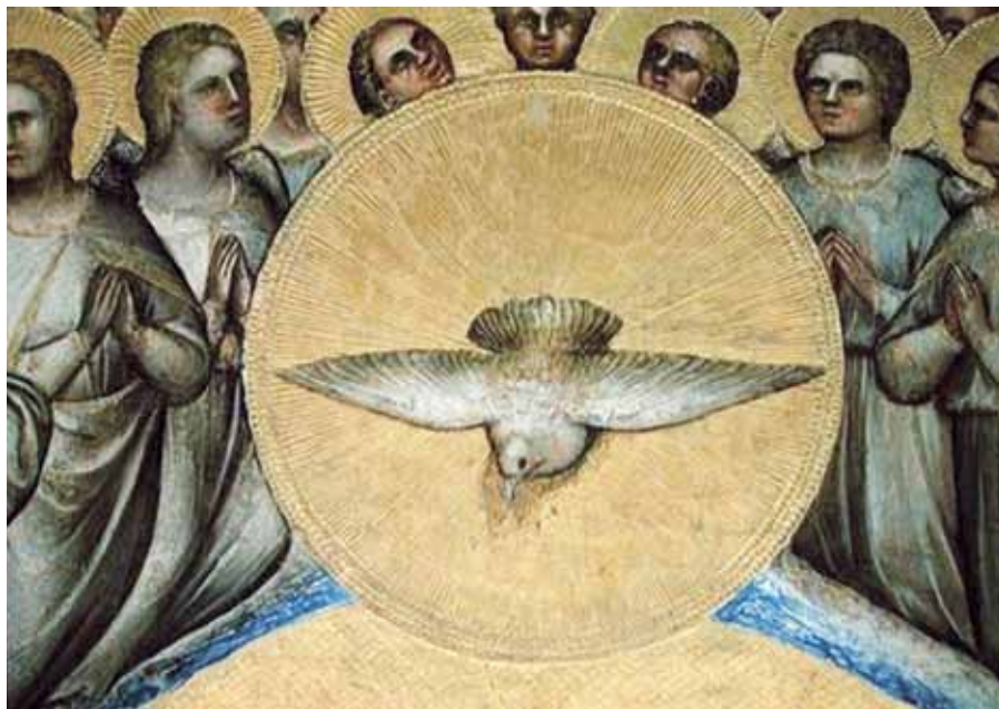
Giusto di Giovanni de' Menabuoi: Holubice Ducha svatého (1360–1370).

tým olejem dříve, než převzali svůj úřad, a požehnání bylo udělováno vztažením rukou nad těmi, kdo měli být požehnáni. Obojí obřad mohl proto velmi dobře naznačovat vylití Ducha Svatého.