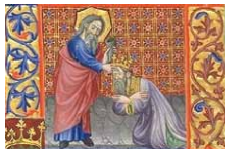
Pomazání Davida Samuelem, breviář Martina d'Áragon (14. stol.).

Téměř od počátku Církve se vyskytovali bludaři, kteří biřmování upírali ráz svátosti. Mezi první se řadí nováciáni, 1 ve středověku to byli albigenští a valdenští, v době reformace Luther a Kalvin. V nejnovější době tvrdili modernisté, že se nedá dokázat apoštolský původ biřmování a že první křesťané neznali rozlišení svátosti křtu od biřmování. 2