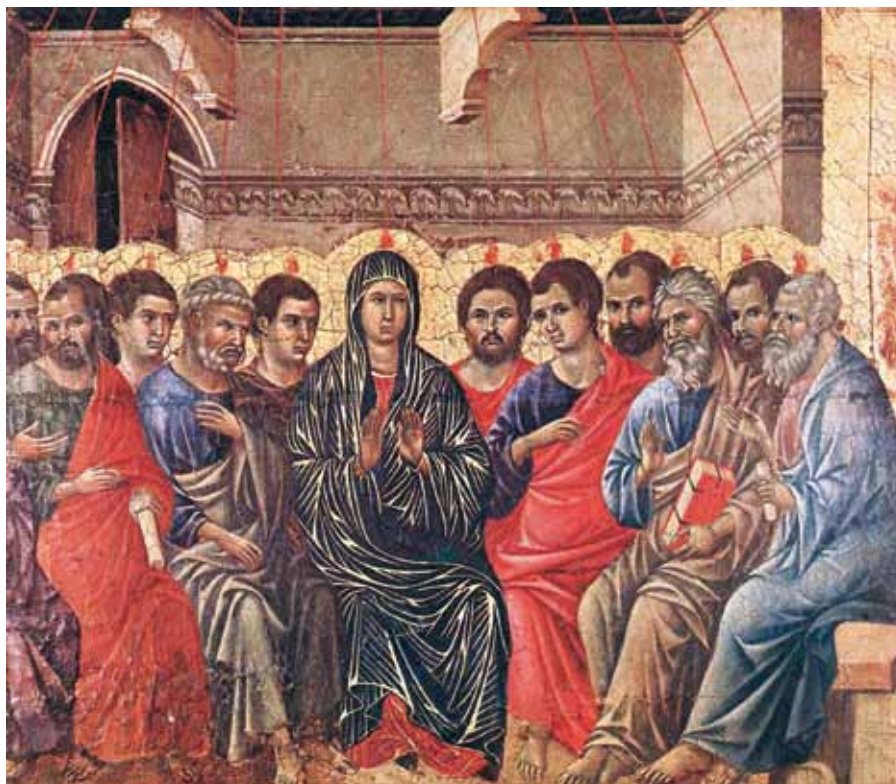
Duccio di Buoninsegna: Letnice (1308–1311).

Ve čtvrtém století máme na Východě důležité svědectví Cyrila Jeruzalémského. Ve svých Katechezích věnuje značné místo i svátosti biřmování. Dvacátá první katecheze má název Peri chrismatos – O biřmování. V ní jsou vyloženy původ, obřady, symbolismus a moc této