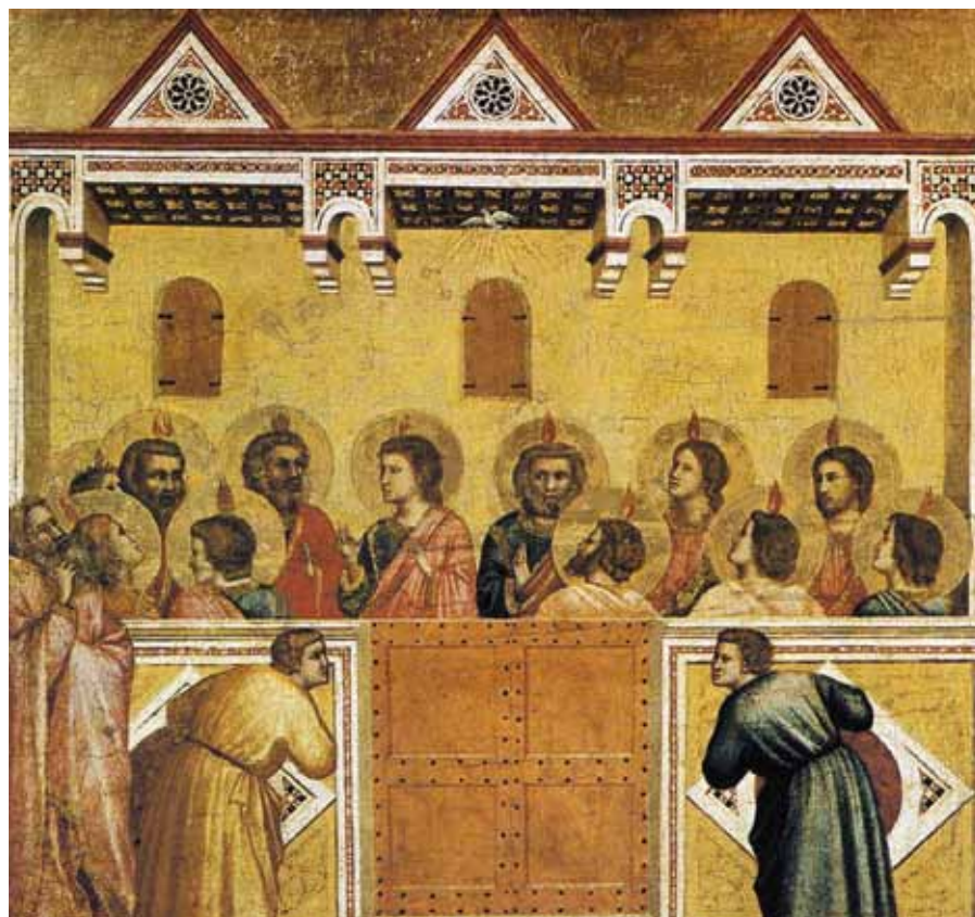
Giottto di Bondone: Letnice (1320–1325).

Té jednoty, která vede k neporušitelnosti, se našim tělům dostalo v křestní koupeli, duším ji dal sám Duch.