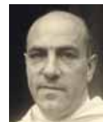
ThDr. Reginald Maria Dacík OP (1907–1988), český teolog, redaktor, publicista, kněz dominikánského řádu

3 Církevní právo stanovuje, že každý věřící, jakmile dospěl do věku užívání rozumu, je povinen alespoň jednou za rok upřímně vyznat své těžké hříchy. Zároveň křesťanům doporučuje, aby vyznávali i lehké hříchy (CIC 988 a 989).