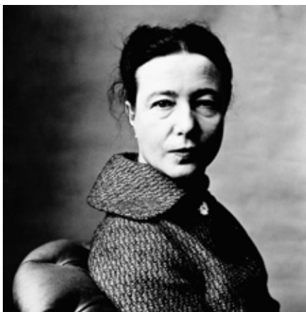
Simone de Beauvoirová, 1957.

Skutečnost je více než prostá – Beauvoirová v žádném případě není mluvčí ani typickou představitelkou žen. Svoboda, kterou prosazuje, mimo jiné neza-