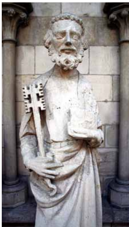
Socha svatého apoštola Petra v rouenské katedrále.

V hlubinách lidské duše je ukryt vrozený cit pro spravedlnost, který nutí člověka učinit nápravu, dopustí-li se na někom křivdy. U všech národů, i nejprimitivnějších, nacházíme jistou potřebu pokání a zadostiučinění za hříchy. Není člověku lépe, když nemusí krutě tíživou vinu nosit jen ve svém srdci, když se s ní může svěřit druhému? A což, když se může vyznáním a pokáním zbavit tíže viny!