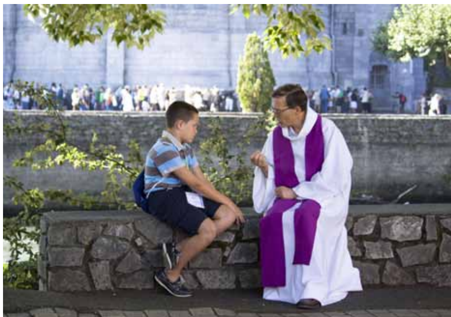
Zpověď v Lurdech.

Připomeňme si ještě, že v 18. kapitole Matoušova evangelia dává Kristus tuto moc všem apoštolům. Když zdůraznil potřebu poslušnosti věřících vůči Círk-