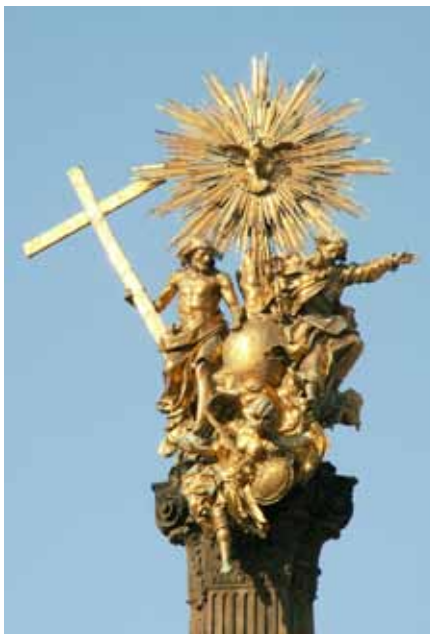
Sousoší Nejsvětější Trojice na stejnojmenném sloupu v Olomouci.

Židovský velekněz každý rok vystupoval s krví obětních zvířat do té části budovy uprostřed vnitřního chrámového nádvoří, kde byla umístěna Archa úmluvy obsahující desky s Desaterem Božích přikázání. Tato část chrámu se nazývala velesvatyně a byla oddělena od zbytku budovy tzv. chrámovou oponou. Vejít do ní směl pouze velekněz, a to jedenkrát za rok v Den smíření, aby tam vzdal Bohu chválu a přimlouval se za sebe, za levity a vyvolený národ. Lid stál mezitím venku, ačkoliv je