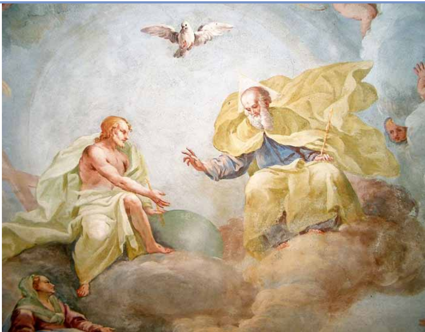
Luca Rossetti da Orta: Svatá Trojice. (1738–9) Freska v turinském kostele sv. Gaudencia.