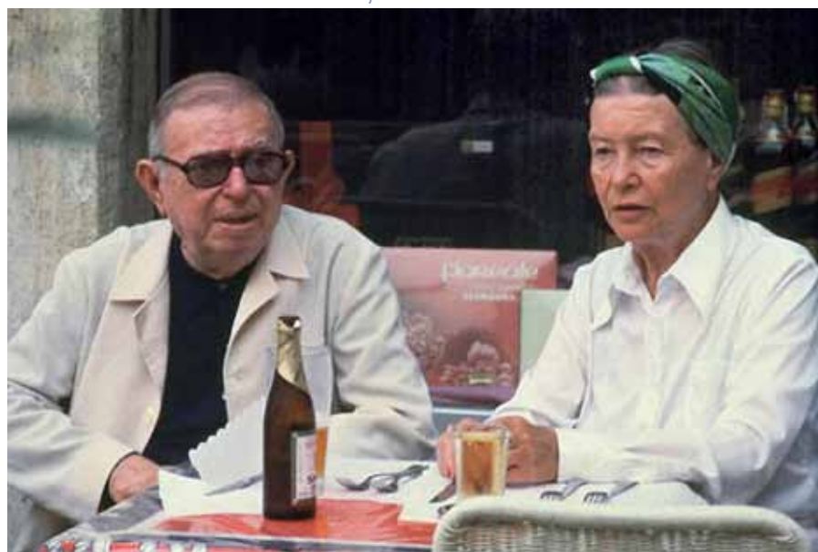
Sartre a Beauvoirová v roce 1978 v Římě.

Sexuální revoluce konce šedesátých let, jež učinila z Beauvoirové ikonu, byla víc než deklarovaným osvobozením od morálních konvencí – zotročením ducha do služeb tělesnosti. S nepřekvapivým odporem se setkala encyklika Pavla VI. Humanae Vitae , která poukazovala na nutnost nahlížet na otázky vztahu muže a ženy, včetně sexuality a porodnosti, v celkovém pohledu na člověka. Svět jednoduchých řešení a velkých revolucí nebyl ochoten celistvý pohled přijmout. Proto Jan Pavel II. během prvních pěti let svého pontifikátu přednesl na 130 katechezích k tématu lidské osoby, sexuality, mužství, ženství a manželství.