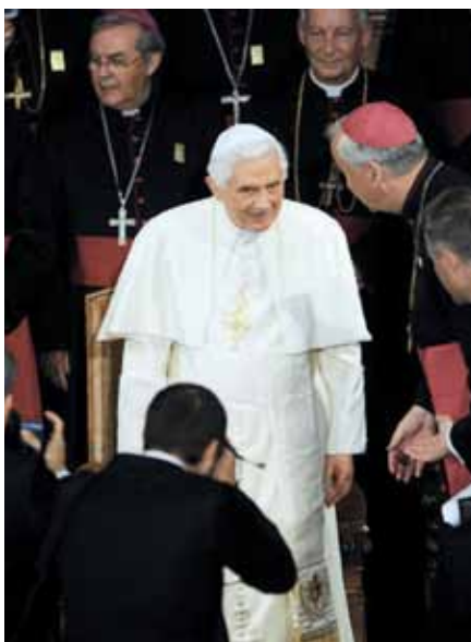
Benedikt XVI. na setkání s biskupy Anglie.

Doufám, že místní katolická církev si z těch čtyř dní odnese mnohá ponaučení. Nejdůležitější se týká správného chápání liturgie. Ve Westminsterské katedrále papež sloužil takovou liturgii, o níž je přesvědčen, že je k uctívání Boha nejvhodnější. Zavedl praxi umístování křížů uprostřed oltáře, která však v Anglii stále není následována. Při všech mších recitoval kánon v latině. To jsou skutečnosti, které netěší magické kruhy liberálních biskupů kontrolujících byrokracii a liturgickou praxi Církvě v Ang-