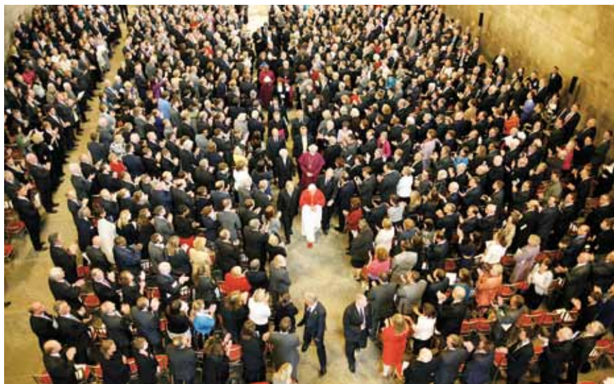
Ovace po papežově promluvě ve Westminster Hall.

Poučí se Církev z úspěchu papežské cesty do Velké Británie?