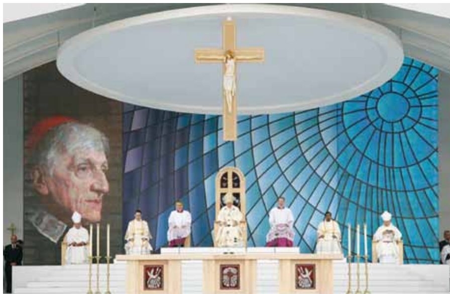
Beatifikační mše svatá v Cofton Park.

„Život je jedinečný dar v jakémkoli stadiu od početí po přirozenou smrt a je pouze na Bohu, zda ho dá či vezme. Člověk se může v pozdním věku těšit dobrému zdraví, přesto by křesťané neměli mít strach z podílu na Kristově utrpení, s nímž se setkáváme v nemoci, pokud to Bůh chce. Můj předchůdce papež Jan Pavel II. v posledních letech svého života veřejně trpěl. Všem bylo jasné, že to prožíval ve spojení s utrpením našeho Spasitele. Jeho radost a trpělivost, s nimiž prožíval své poslední dny, byly významným