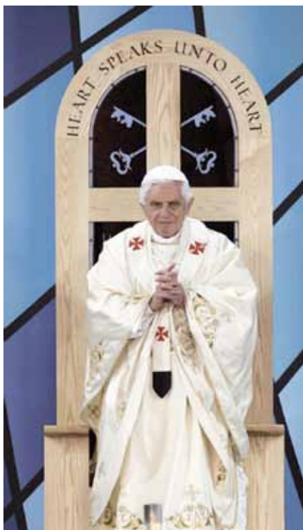
Heart speaks unto heart • Cor ad cor loquitur • Od srdce k srdci – Téma návštěvy převzaté z motto kardinála Johna Henryho Newmana