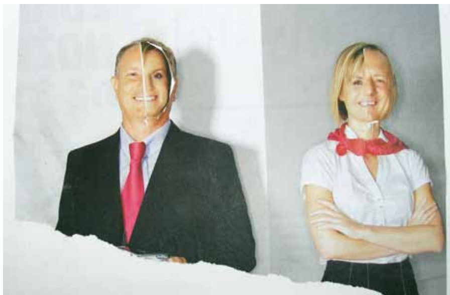
Je doemancipováno!

Ženská emancipace se poněkud vymkla z rukou. Takhle to John Stuart Mill bezpochyby nemyslel, když horoval za volební právo pro něžné pohlaví. Ženy již mohou bez problémů pracovat, volit a být voleny, učit se a vyučovat, vstupovat kam chtějí, nechodit kam nechťejí... S radostí bych se hned poklonil té, která by konečně svésila prapor a vyhlásila, že je doemancipováno. Protože čeho jsme svědky, už jde nad rámec normálnosti a blíží se hranici šílenosti. Pokud už ji ne-