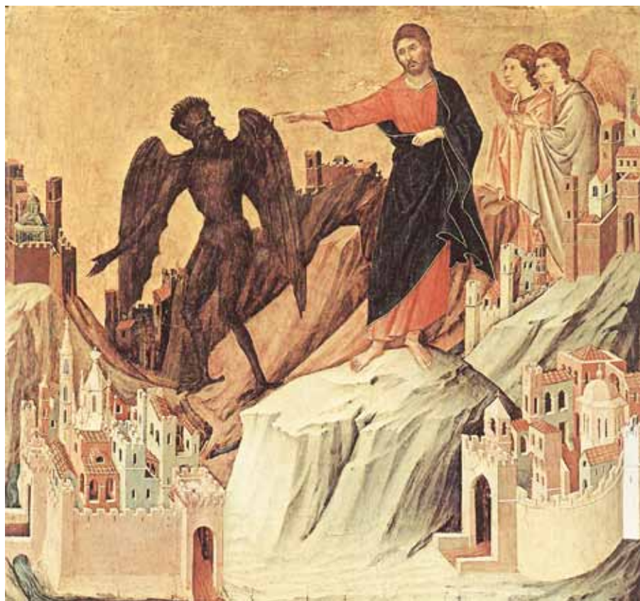
Duccio di Buoninsegna: Pokušení Krista na hoře (1308–1311).

První fáze je fáze pasivity. Tam, kde jsou socialisté a liberálové s podporou