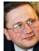
Autor je novinář a komentátor, šéfredaktor časopisu Duše a hvězdy, člen MKD a HPŽ ČR.

Článek byl zveřejněn na webovém portálu Duše a hvězdy ( http://cirkev.wordpress.com ) a v upravené verzi i v Konzervativních listech ( www.konzervativnilisty.cz ).