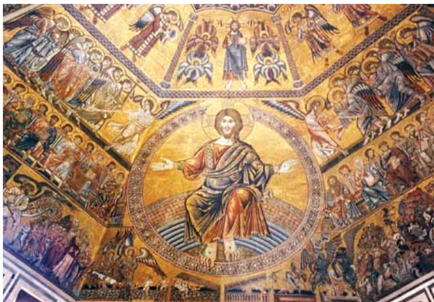
Křístus na trůnu, Baptisterium San Giovanni, Florencie (13. stol.).

Hospodinova sláva. Jaká sláva? Je to zajiště kříž, na němž byl oslaven Kristus. Neboť on je odlesk slávy Otcovy, jak sám řekl před svým utrpením: Nyní je oslaven Syn člověka a Bůh je oslaven v něm, ano, hned ho oslaví. Slávou nazývá Kristus na tomto místě své vyvýšení na kříž. Neboť kříž je Kristovou slávou, ano, jeho povýšením. Sám přece říká: A já až budu vyvýšen, potáhnu všechny k sobě.