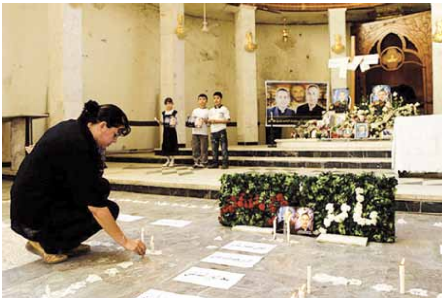
Zapalování svíček za oběti masakru v bagdádské katedrále.

Iráckí křesťané odcházejí zpravidla do zemí, kde mají početnější diasporu,