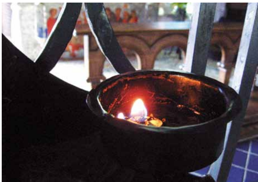
Kaple Maranatha ve Valle de Bravo, Mexiko.

Pouč' mě, jak tě mám hledat a zjev se hledajícímu. Nemohu tě hledat, nenaučíš-li mě tomu, ani tě nalézt, nezjevíš-li se. Kéž tě hledám svou touhou, kéž po tobě toužím hledáním; kéž tě naleznu svou láskou, kéž tě miluji nalézáním.