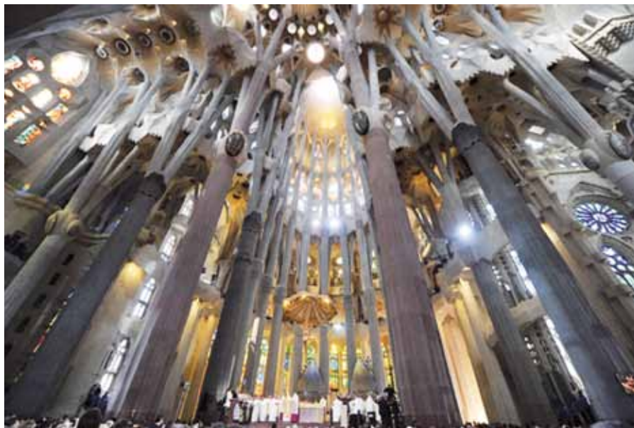
Mše svatá v Sagrada Familia.

„Nepřestávejte si brát poučení od tohoto Krista na křížovatkách cest a života. Bůh nám v něm vychází vstříc jako přítel, otec a průvodce. Požehnaný Kříž, kéž vždycky záříš v zemích Evropy! Dovolte mu, aby odtud hlásal slávu člověka, který vnímá, že je ohrožena jeho