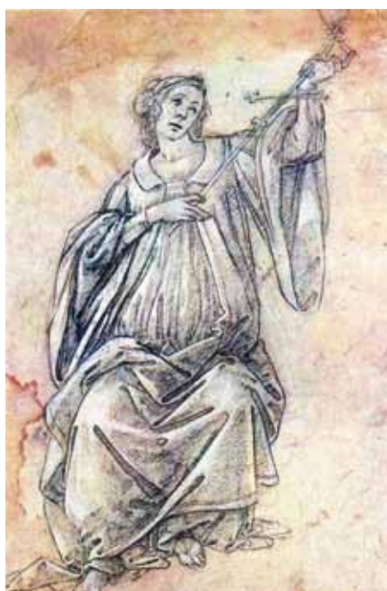
Sandro Botticelli: Alegorie věrnosti

Po mém soudu lze s čistým svědomím říci, že klíčová otázka dalšího směřování Mladých křesťanských demokratů zní: „Jak udržet křesťanské hodnoty v naší domácí politice?“, nikoli: „Jak za-