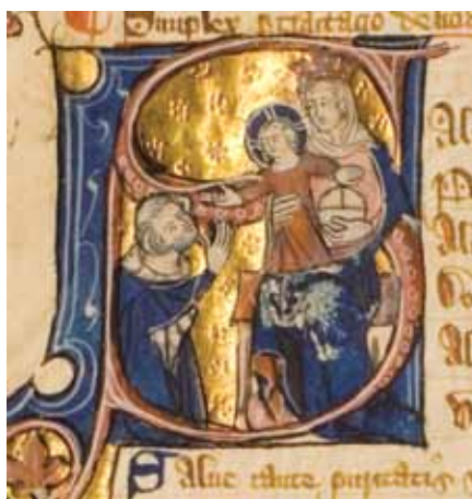
Matka Slova a Matka radosti. Illuminovaný rukopis ze 14. stol.

ke svému úkolu přistupovat s náležitým vědomím velikosti služby, kterou koná. Svátosti i svátostiny jsou ve své podstatě Boží slovo, kterým Pán působí to, co říká. Denní modlitba Církve je plně biblickou modlitbou. K účinnému naslouchání Bo- žího hlasu patří ticho, mlčení, které je tře- ba v liturgii i v osobním duchovním životě přísně střežit jako cenný poklad.