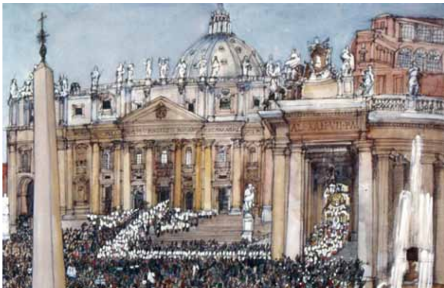
Franklin McMahon: II. vatikánský koncil, zahajovací procesí.

jít pravou Církve: „Tato Církve, ustavená a uspořádaná na zemi jako společnost, subsistuje (uskutečňuje se) v katolické církvi“ ( Lumen gentium 8). A aby se zabránilo každému nedorozumění ohledně identifikace pravé Kristovy církve s církvi katolickou, je připojeno, že se jedná o Církve, která „je řízena Petrovým nástupcem a biskupy ve společenství s ním“ ( Lumen gentium 8).