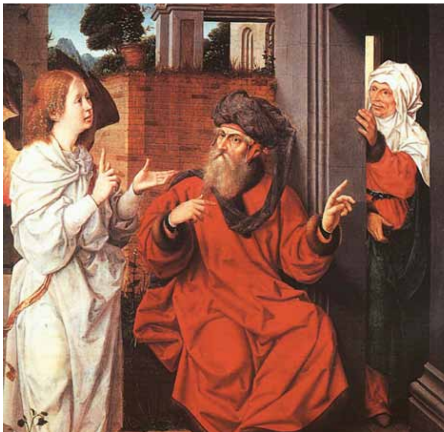
Jan Provost: Abrahám, Sára a anděl (1520). Foto: artrenewal.org

místo tvorby spermií. Další nepříznivý vliv na kvalitu spermií mohou mít různé infekce, léky, chronické choroby atd. Pokud se nám podaří tyto negativní vlivy eliminovat, trvá cca 3 měsíce, než se kvalita spermií opět vylepší. Většina příčin snížené plodnosti u muže je léčitelná. Množství a kvalita spermií se dají zjistit pomocí spermogramu. Pro odběr spermií je však zapotřebí masturbace, což je opět morálně nepřijatelné. Mnoho mužů to takto vnímá a příliš toto vyšetření nevyhledává. Spermogram je ovšem relativní veličina, která neříká nic o příčině snížené plodnosti muže a různě se v čase mění. Z praxe víme, že normální výsledek spermogramu u jinak zdravého manželského páru nemusí vést k otěhotnění a naopak klidně dojde k otěhotnění u manželského páru se špatným výsledkem spermogramu. Pokud manželé chtějí jednat morálně správně a snaží se vyhnout se spermogramem spojené masturbaci, mají několik možností. Především vyloučit nejčastější příčiny neplodnosti u muže, které by mohly vést