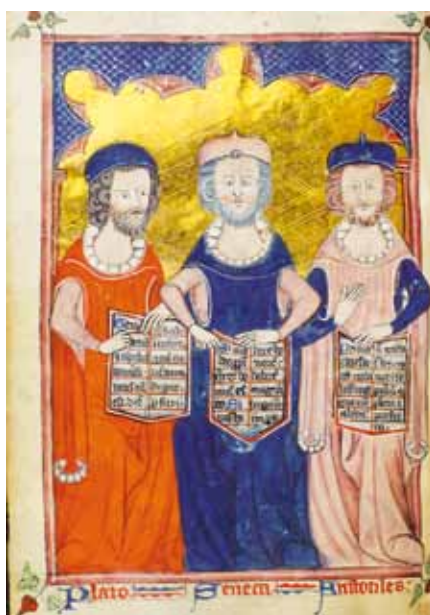
Platón, Seneca a Aristoteles. Hunterův žaltář (12. stol.)

Platón i Aristoteles chápali mravní život jako cestu přirozeného zbožšťování člověka. Nahlíželi, že postupné vrůstání pravdy a dobra do lidských životů dává lidem účast na transcendentních hodnotách.