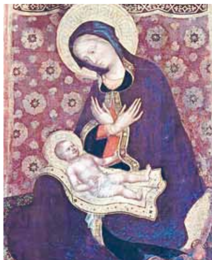
Gentile da Fabriano: Madona (1416).

kou a životem; a proto ti vyšel naproti, připodobnil se ti, stal se Ježíšem, Boho-člověkem, ve všem ti podobným kromě hříchu; sebe samého dal za tebe smrtí na kříži, a tak ti dal nový život, svobodný, svatý a neposkrvněný“ (srov. Ef 1,3–5).