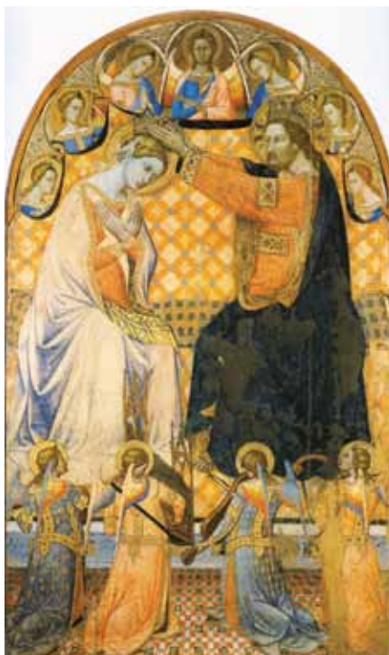
Giacomo di Mino: Korunování Panny Marie (1340–1350)

K dynamickému rozměru lidského života nepatří jen fakt a způsob počátku jeho existence, ale i postupný rozvoj již jsoucí lidské reality. Většina z nás je přesvědčena o tom, že jsme v řadě ohledů svobodnými bytostmi, že nejednáme pod taktovkou nějaké nutnosti. Pokud bychom však vydali naše myšlení všanc v současnosti prosperujícím přírodním a sociálním vědám, zjistili bychom, že se z nich prostor pro naši svobodu ztratí. A na tom není nic překvapivého. Tyto