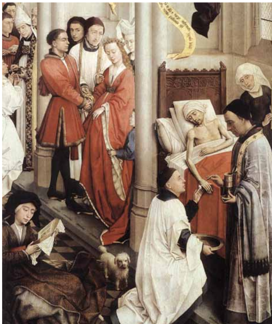
Rogier van der Weyden, Sedm svátostí , detail (1445).

Vzpomeňme si na scénu, kdy před Krista obklopeného množstvím lidí spustili na nosítkách otvorem ve střeše domu ochrnutého člověka. Kristova první slova byla: Synu, odpouštějí se ti hřích (Mk 2,5). Teprve na potvrzení své moci odpouštět hřích uzdravil ochrnutého také z jeho nemoci. Vidíme zde pořadí důležitosti hodnot. Nejdůležitější je odpuštění hříchů. Hřích jako nemoc duše je příčinou veškerého, i fyzického zla ve světě, tedy také nemoci. Hřích je příčinou smrti. Uzdravením od hřichu je uvolněna cesta k celkovému zdraví člověka. Tak ve svátosti pomazání nemocných je hlavním účinkem zvláštní dar Ducha Svatého. Milost útěchy, pokoje a odvahy. Tato síla, která pomáhá nemocnému, aby se přidružil k utrpení Kristovu, ho chce přivést k uzdravení duše, ale i těla, pokud to prospěje k jeho spáse. Člověk, který je Pánem v této svátosti posílen a pozvedán, se otvírá jeho přítomnosti, a ta působí odpuštění všech hříchů a přiměřeně dispozici člověka i odpuštění časných trestů za ně. Tak je nemocný posvěcen Kristovou přítomností a jeho utrpení se stává účastí na Ježíšově vykupitelském díle a přináší ovoce vykoupění pro Cír-