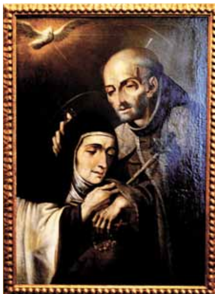
Melchor Pérez de Holguín, Sv. Petr z Alcantary se sv. Terezií z Avily (1701)