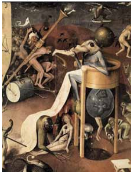
Hieronymus Bosch, Zahrada pozemských slasti, detail (1500)

nování rodiny, za jehož nedílnou součást považovala i potrat. Její agentura na smrt úspěšně funguje i v 21. století.