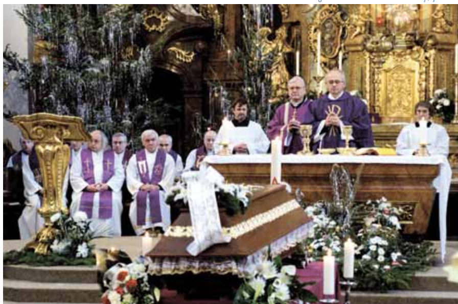
Poslední rozloučení v kostele sv. Ignáce.

vané Církvi v Československu, jejíž biskupové byli ve vězeních nebo internaci a církevní správa ochromena dohledem komunistických církevních tajemníků. Usilovné pokusy o jmenování nových biskupů využívala komunistická diplomacie k vydírání. Při každém jednání v Praze nebo ve Vatikánu zarputile opakovala: „Válečný štváč a zavilý nepřítel ČSSR i socialismu Ovečka je jasným důkazem nepřátelského postoje Vatikánu k ČSSR, který dennodenně využívá vatikánského rozhlasu ke své podvrtné činnosti.“ Když se pak vedoucí vatikánské delegace arcibiskup Casarolli ptal, jak konkrétně, uváděli zprávy „o internovaných biskupech, uvězněných kněžích a stovkách laiků, o lživé diskriminaci katolíků, jejich dětí ve školách, a to i po několika měsících od inkriminované konkrétní události s jasným záměrem očerňování dobrého jména ČSSR (tak dlouho leckdy trvalo, než se nějaká zpráva dostala od nás do Říma). A zvláště po vypovězení pražského arcibiskupa Berana, jeho jmenování kardinálem a jeho činnosti ve světě „nepřátelsky zaměřené proti ČSSR“. A opravdu kardinál Beran byl hodně zván do různých italských měst i zemí Evropy, do USA a Kanady a pochopitelně novináři toho používali, aby vylíčili situaci pronásledování Církve v ČSSR a bezpráví komunistického režimu. P. Ovečka pak o tom poctivě referoval v rozhlasovém vysílání, což mu komu-