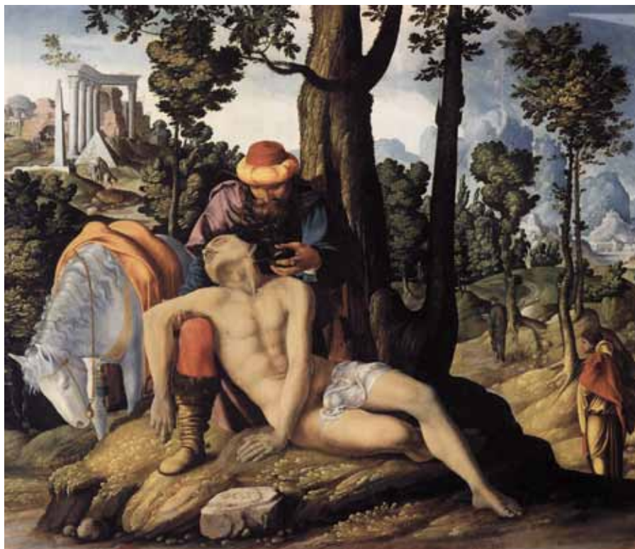
Neznámý holandský mistr: Milosrdný samaritán (1537).

Chtěl bych zde navázat na Poselství k chudým, nemocným a ke všem, kteří trpí , jímž se koncilní otcové obrátili k světu na závěr II. vatikánského koncilu: Vy všichni, kteří cítíte velkou tíhu kříže, [...] vy, kteří pláčete [...] vy, neznámí trpící, naberte odvahu; vy jste upřednostňováni v nebeském království, v království naděje, štěstí a života; jste bratry trpícího Krista a budete-li chtít, vy s ním spasíte svět! 5 Ze srdce děkuji lidem, kteří každý den konají službu u nemocných a trpících a zastávají ji tak, aby apoštolát Božího milosrdenství, jemuž se věnují, stále lépe odpovídal novým požadavkům. 6