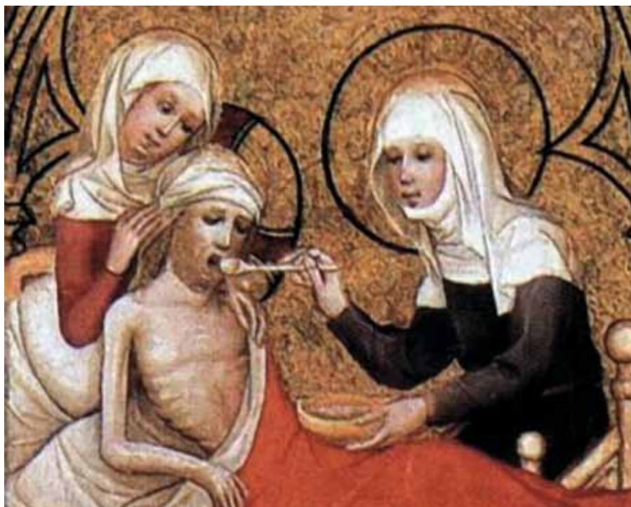
Neznámý autor, Svatá Alžběta pečuje o nemocné (1390).

K této radosti ať tě povznese naděje a ať láska roznlití tvou horlivost, aby náležitě opojená duše zapoměla na to, co trpí zvenčí, a vzplanula a zamilovala k tomu, o čem uvnitř rozjímá.