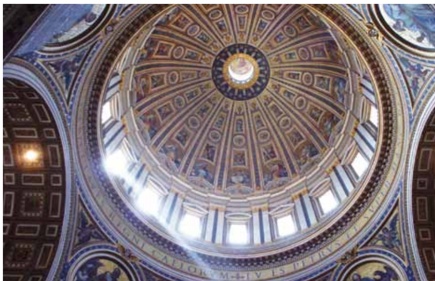
Tu es Petrus... Bazilika sv. Petra v Římě.

Kdo tedy s vírou sestupuje do této koupelie znovuzrození, odřídí se ďábla a spojuje se s Kristem; odmítá nepřítel a vyznává, že Kristus je Bůh, svléká otroctví a odívá se darovaným synovstvím; od křtu se navrácí jasný jako slunce a vyznačuje paprsky spravedlnosti; a co je nejdůležitější, stává se synem Božím a spoludědicem Kristovým.