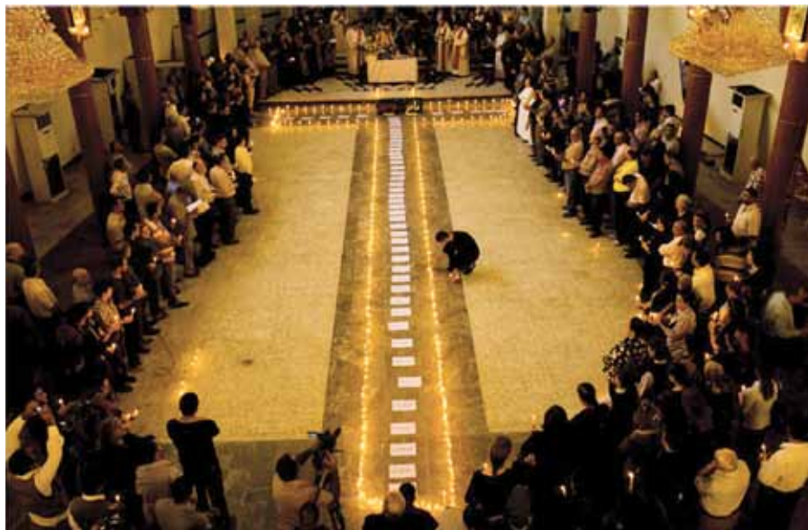
Modlitby za zavražděné irácké křesťany.

My, níže podepsaní občané České republiky, prostřednictvím této petice vyjadřujeme své znepokojení a pobouření nad silícím pronásledováním křesťanů ve světě a požadujeme po českých politikách a obhájících lidských práv, aby mu věnovali více pozornosti. Vyzýváme je, aby neváhali intervenovat ve prospěch pronásledovaných, poskytovat jim pomoc a v případě potřeby i bezpečí azylu. Děkujeme.