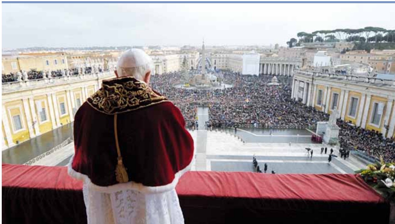
Benedikt XVI. pronáší vánoční poselství z centrální lodžie baziliky sv. Petra.