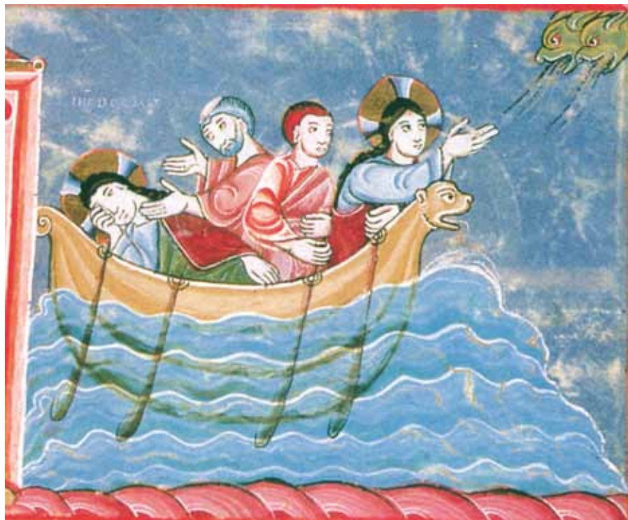
Ježíš utiňuje bouři. Evangelistař z Echternachu (11. stol.).

Kdyby před pár lety, nebo před několika desítkami let některý papež přirovnal Církev k ženě nádherné, leč pošpiněné hříchy kněží, byla by z toho senzace. Pamatujeme si ještě, jaké diskuse vyvolala poslední Křížová cesta Jana Pavla II., při níž kardinál Ratzinger přirovnal Církev k potápějící se lodi. Dnes ostrá papežova slova o hříších duchovenstva prousťtí téměř bez povšimnutí. Zvykli jsme si na takové mluvení i psaní o kněžích. Hříchy hrstky zvrhlíků a zanedbání podobně nevelké části světového episkopátu dokázaly zaclonit normální, někdy velmi obětavý život většiny. Tak to ale přece být nesmí, vždyť kněžství a kněží jsou jednou z nejkrásnějších věcí, jaké Církev má. V souvislosti s kněžským rokem zakončeným loni v červnu to připomněl papež během tradičního předvánočního setkání s Římskou kurií. „Znovu jsme si uvědomili – řekl –, jak je úžasné, že lidské bytosti jsou autorizovány vyslovovat Božím jménem a plnou mocí slova odpuštění,