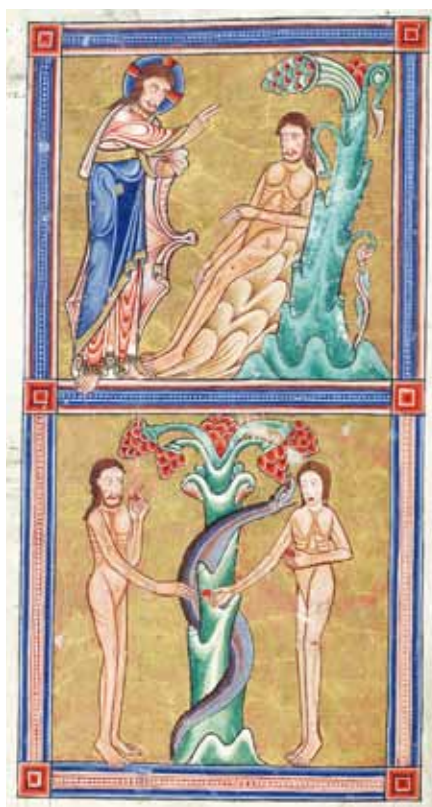
Stvoření člověka a první hřích. Hunterův žaltář (12. stol.)