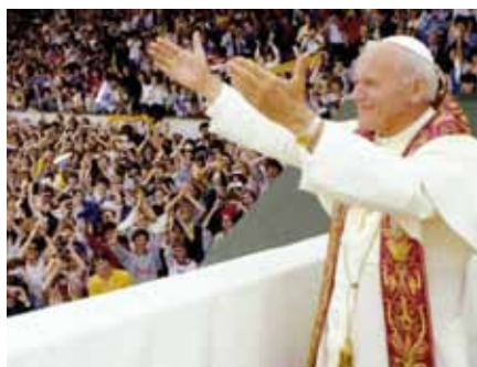
Jan Pavel II.

že mladí lidé mají převzít odpovědnost na poli evangelizace svých vrstevníků, a neustále je povzbuzoval k odvaze ujmout se tohoto svého úkolu. V pastorační mládeže, která byla do té doby vnímána jako výlučná záležitost školského systému, katechetů, některých řeholí či charismatických jedinců, zdůraznil roli biskupa a jeho pastýřské a koordinační poslání. Celou Církev učil systema-