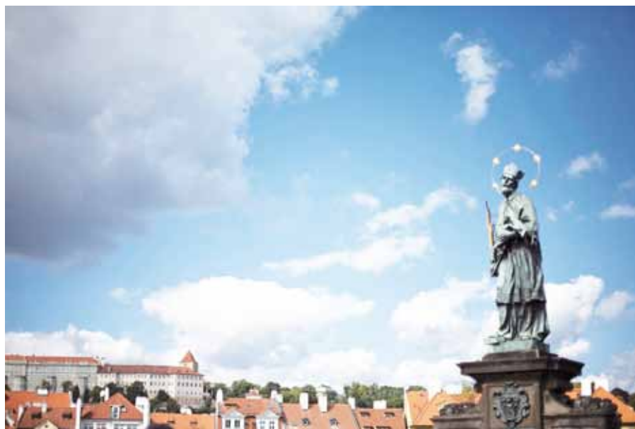
Socha sv. Jana Nepomuckého na Karlově mostě.

Stejně jako nemůže zůstat beránek mezi vlky nedotčený, není si jist ani spravedlivý mezi hříšníky. Hříšník totiž usiluje spravedlivému o život nejrůznějšími intrikami, výslechy, léčkami, trýzněním, vražděním.