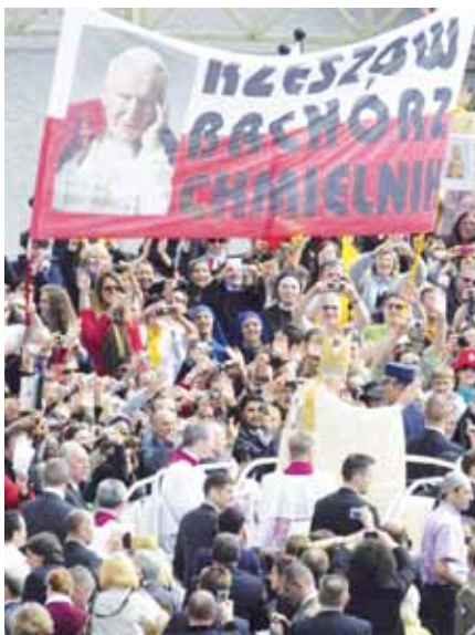
Beatifikace Jana Pavla II. – Benedikt XVI. zdraví poutníky

Beatifikace nám také napověděla, jakým svatým bude Jan Pavel II. Jak víme, svatý svatému neroven. Jsou světci ke čtení, jako Pavel, Augustin nebo Tomáš. Jiní prosluli díky praktickým radám pro všední den, jako Ignác z Loyoly nebo Josemaría Escrivá. A jsou další, známí z činorodé přítomnosti v životě věřících, připomeňme jen Josefa, Antonína nebo O. Pia. Jaký bude Jan Pavel II.? Napsal mnoho, ale je spíš těžkým autorem. V minulých dnech mi propluly před očima