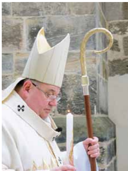
„Tak ať vaše světlo svítí lidem“ (Mt 5,16) Mons. Dominik Duka OP

Mons. Dominik Duka OP, arcibiskup pražský a primas český www.apha.cz