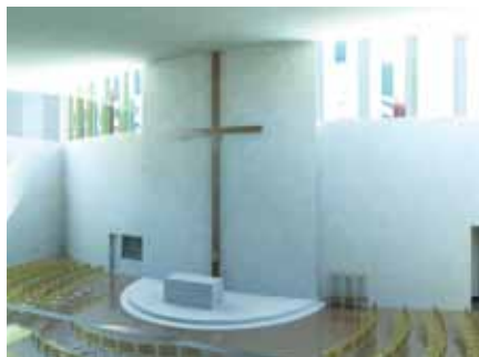
Ukázky studentských návrhů kostela na Barrandově

dají, ale jejich odpovědi se liší. Pravdou je, že Bůh chrám nepotřebuje. I Církev se bez chrámu obejde. Máme být chrámem duchovním, živými kameny. Otázka potřeby chrámu je otázkou po vlastnostech člověka, nikoli otázkou po vlastnostech Boha a zní takto: pomáhá nám posvátný prostor k tomu, abychom se sami stali chrámem duchovním, nebo nám v tom posvátný prostor naopak překáží? Zve posvátný prostor i ostatní, nebo je naopak odrazuje? Studenti architektury se domnívají, že pomáhá a zve.