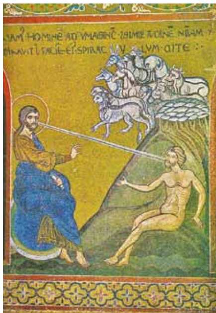
Stvoření Adama, Monreale (12. stol.)

denně. Průměrný rozdíl v sekvenci DNA mezi člověkem a šimpanzem je 1 %. Jak dlouho vám bude trvat, než se změníte v opici? Co je chybného na tomto tvrzení? Odpověď najdeme na str. A-18.: Tvrzení je zcela nesprávné. Nemůžeme změnit jeden druh v jiný jenom zavedením 1 % náhodných změn do DNA. Je značně nepravděpodobné, že oněch 5 000 mutací za den nastane v pozicích, ve kterých se lidská a šimpanzí DNA liší. Navíc je zde