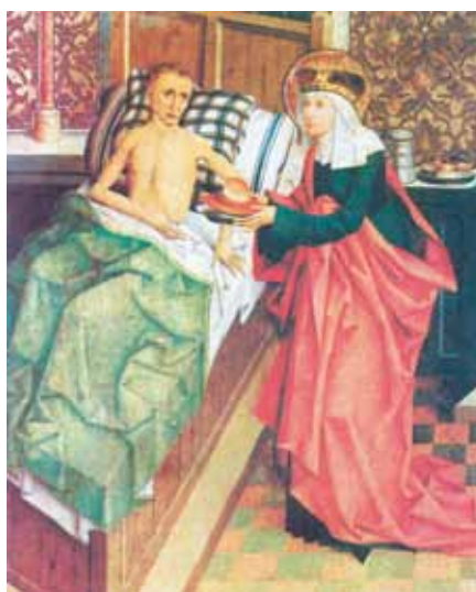
Mikuláš Puchner: Svatá Anežka ošetřuje chorého (1482)

Kéž bychom byli jen jako malé děti, které si dají na hlavu ručník a myslí, že je nevidíme, protože přestanou vidět nás. Kéž by! Naše společnost nechce vidět smrt. Přitom je smrtí zcela ovládána.