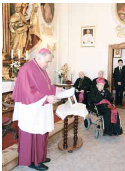
Slavnostní shromáždění v kapli biskupství při příležitosti jmenování nového biskupa