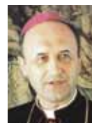
Mons. Jan Graubner, arcibiskup olomoucký a metropolita moravský

Mons. Jan Graubner (Mezititulky redakce)