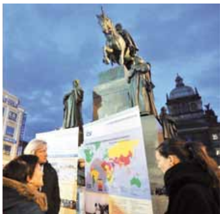
Shromáždění na podporu pronásledovaných křesťanů