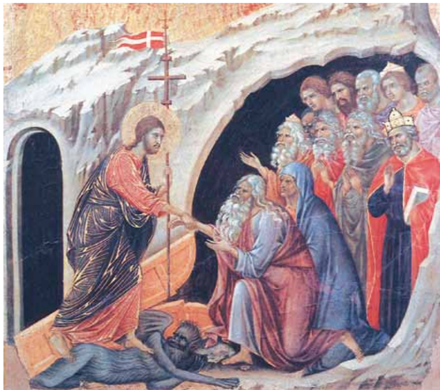
Duccio di Buoninsegna: Sestoupení do pekel (1308–1311).

Netřeba podrobně rozvádět neutuchající kauzy zneužívání mladistvých kněžími, resp. kauzy pedofilních kněží, jak zní nepřesná a o to častěji naschvál používaná novinářská zkratka. Scénář medializovaných případů bývá až trapně stejný: Na počátku je ojedinelý a poměrně starý skutečný zločin daného druhu; zasunutá záležitost se po právu dostává k soudu a zároveň je – právníky, médii či libovolným proticírkevníkem či ziskuchtivcem – úmyslně obalována příběhy, jejichž množství a smyšlenost se navzájem předbíhají; církev pak bolí zlý skutek samotný a ta fůra bájí kolem bolesti ještě rozdráždí. Příklad z mnoha: „...zneužívání dětí, kterého se údajně dopouštělo nespočet diecézních a řádových kněží od počátku 60. let...“ (ČTK, 3. 2. 2011) Jaké „údajně“, jaký „nespočet“?! Jednomu to až pění krev a je pochopitelné, že i křesťan z toho dostává vztek. Zlostná