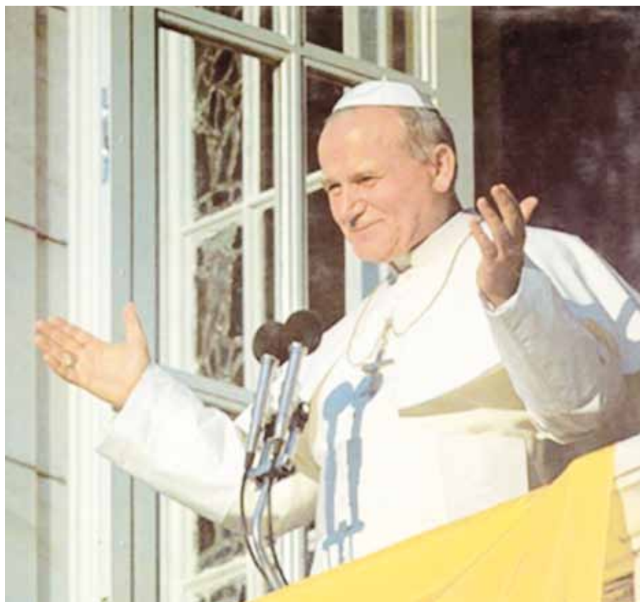
Jan Pavel II.