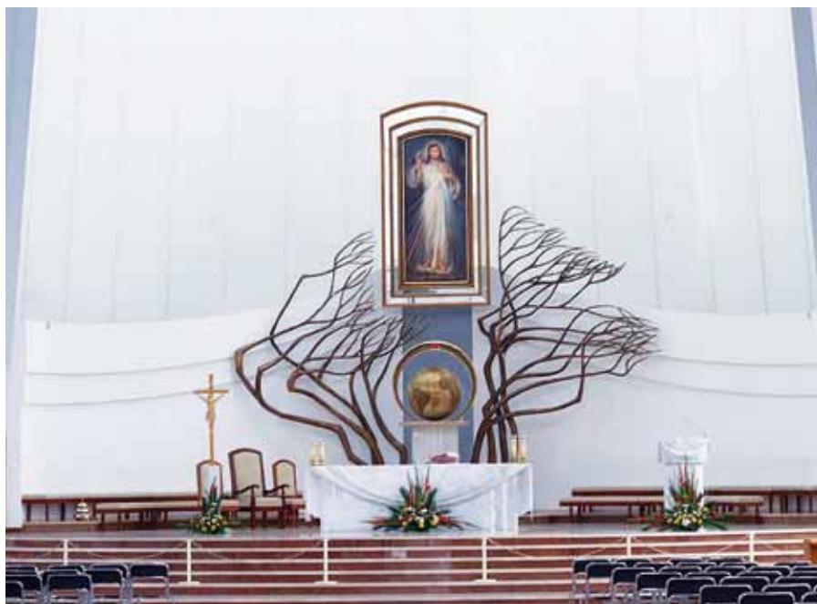
Oltář v Bazilice Božího Milosrdenství v Lagiewnikách u Krakova.

Nuže, nabídněme Kristu svou lásku jako velkou a všezahrnující obět'. Ať tryská bohatství našich chvalozpěvů a modliteb k tomu, který nabídl Bohu za obět' svůj kříž, abychom skrze něj byli všichni štědrě obdarováni.