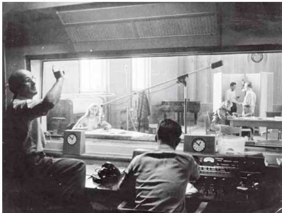
Rádio Svobodná Evropa, studio v Mnichově.