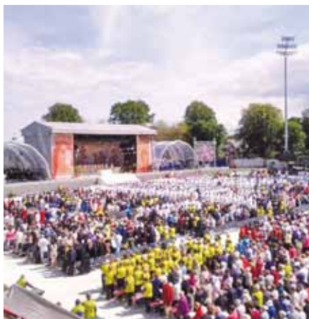
Mše svatá na závěr Eucharistického kongresu v Dublinu