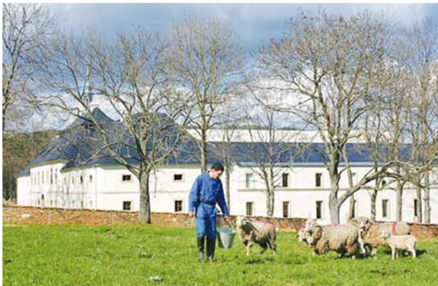
Trapistický klášter Matky Boží v Novém Dvoře.

rozpočet, čímž bude splněn požadavek, aby jak stávající, tak nově registrované církve a náboženské společnosti (hinduisté, Hnutí Hare Krišna, buddhisté atd.) nebyly financovány ze státního rozpočtu.