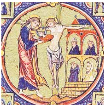
Zrození Církve z Kristova probodeného boku (1250)

Co se míní termínem „eucharistická eklesiologie (nauka o církvi)“? Nejprve, že Ježíšova Poslední večeře se stává poznatelná jako akt založení Církve: Ježíš svěruje svým učedníkům liturgii své smrti a svého zmrtychvstání a dává jim tak slavnost života. V Poslední večeři opakuje Sinajskou smlouvu, či spíše: Co tam bylo jen jakýmsi náběhem ve znamení, stává se nyní skutečností – společenství krve a života mezi Bohem a člověkem. Když to říkáme, je jasné, že Poslední večeře předjímá kříž a zmrtychvstání a zároveň je nutně předpokládá, neboť jinak by vše zůstalo prázdným gestem. Proto mohli církevní otcové velmi krásným obrazem vyjádřit, že Církev vytryskla z probodeného boku Pána, z něhož vytékala krev a voda. To je ve skutečnosti totéž, jen řečeno z druhé strany, jako když formuluji: Poslední večeře je počátkem Církve. Protože to vždy znamená, že eucharistie lidi shromažďuje, ne pouze navzájem, nýbrž s Kristem, a že tak z lidí