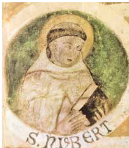
Svatý Norbert, italská freska (14. stol.).

Společenské povinnosti jej vedou jednoho letního dne roku 1115 do městečka Vreden. Na cestě jej potkává bouřka, blesk sjede nedaleko jeho koně, kůň se plaší, shazuje Norberta do bláta. Norbert jasně slyší výzvu změnit svůj život, za-