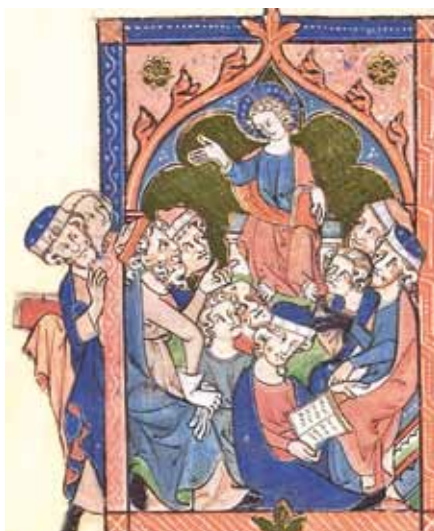
Ježíš učí. Žaltář z Ramsey (1310).

Rodič: Lidé tehdy uvažovali takto: „Ano, Ježíš dělá zázraky. Ale co ze sebe dělá? Mesiáš! Copak Mesiáš může přijít z chudé rodiny? Mesiáš přijde ve slávě přímo z nebe. S velikou mocí a slávou. Ježíšovi stouplo do hlavy, že je slavný, že uzdravuje nemocné. Pomátl se z toho všeho!“