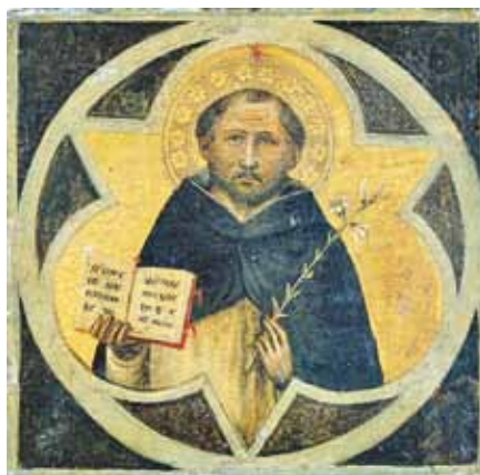
Neznámý florentský malíř: Svatý Dominik (14. stol.)