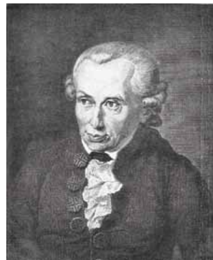
J. L. Raab: Immanuel Kant (1791).

Když Kant vstupuje do problému, je jeho zrak upřen jediným směrem – vynaložit veškeré úsilí k záchraně vědy a překonat rozpor, který do filosofie protistojně instalovali Descartes s Lockem a na jehož konsekvence Hume poukázal. Tato umanutá zahleděnost se Kantovi – a bohužel i novověké filosofii – stala osudnou. Nesoustředil se na otázku po možnosti pravdy tak jako předtím Descartes, čímž mohl pro filosofii vybojovat skutečně velkolepý boj. Místo toho jen trpně přebíral jako pevně dané oba základní noetické omyly – vrozené ideje a empirismus – a svým monstrózním dílem je natrvalo petrifikoval v teorii poznání.