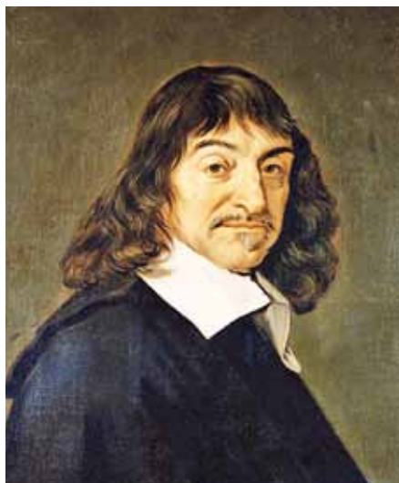
Frans Hals: René Descartes (1648).

Descartovo působení nezačíná na poli filosofie. Největší úspěch zaznamenal v analytické geometrii, významné byly též jeho pokusy o sestavení fyzikálního obrazu světa. Již tam projevil charakteristické rysy svého myšlení – jistotu překotnosti a převážné spoléhání na teoretické konstrukce rozumu. Přece byl pro své vědecké úspěchy veřejně vyzván – jak sám svědčí –, aby se ujal filosofického tématu a zjednal i ve filosofii pořádek. Tohoto úkolu se Descartes se sebedůvěrou sobě vlastní ujal.