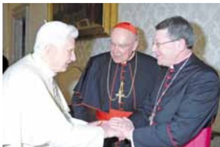
Benedikt XVI. s Msgr. Keithem Newtonem

Rozhodnutí svítit ženy na biskupy významně poznamenává budoucnost ekumenických vztahů anglikánské církve nejen s katolíky, ale také se všemi východními církvemi. Třeba ovšem přiznat, že britská větev anglikanismu nepatří k „nejpokrokovějším“. Anglikáni ve Spojených státech, tvořící tzv. episkopální církev, mají rozhodování o biskupkách už dávno za sebou. Nyní přistoupili k dal-