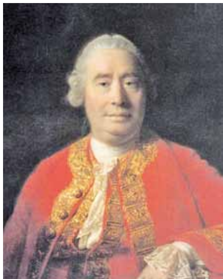
Allan Ramsay: David Hume (1766).

ně opačné strany než Descartes. I jeho postup a výsledek přináší dvě filosoficky neobhajitelné skutečnosti.