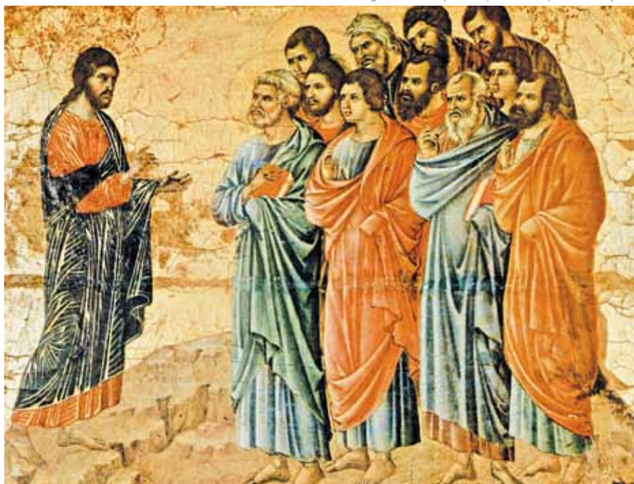
Duccio di Buoninsegna: Poslání apoštolů (1308–1311).

Apoštolské poslání musí vždy zahrnovat oba aspekty: hlásání Božího slova a projevy Jeho dobroty v gestech lásky, služby a oddanosti.