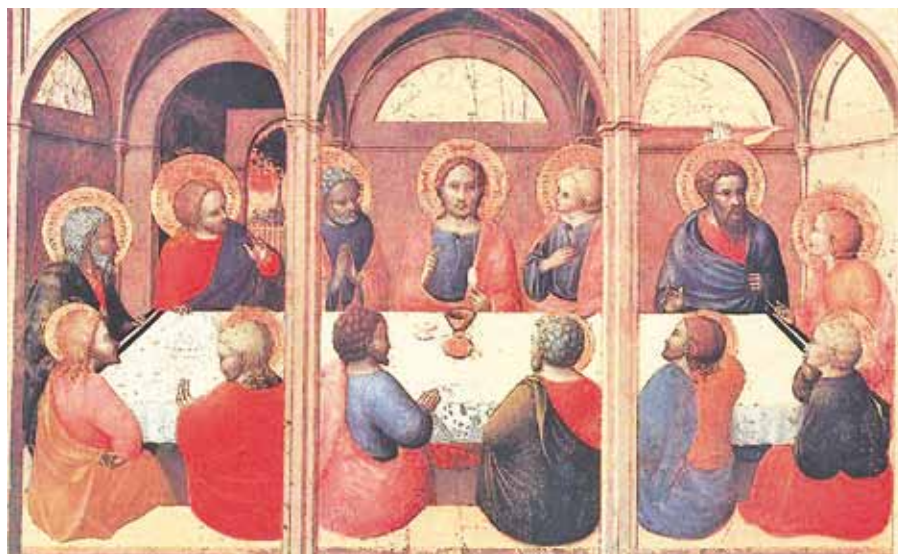
Stefano di Giovanni: Poslední večeře (1423). Foto: Wikimedia Commons

Společenství věřících je také rodinou, a poutem spojujícím členy této rodiny je Ježíš v eucharistii. On je otcem, jenž prostírá své rodině stůl. Křesťanské bratrství bylo vyhlášeno spolu s otcovstvím Ježíše Krista při Poslední večeři. Tam říká Ježíš svým apoštolům „dítka“ a příkazuje jim, aby se vzájemně milovali tak, jako on miloval je.