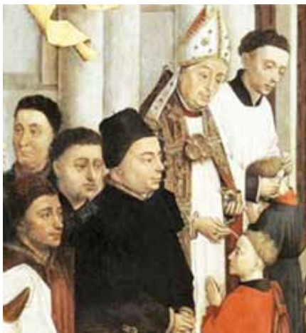
Rogier van der Weyden: Sedm svátostí, detail (15. stol.)

V 8. kapitole Skutků apoštolů se vypráví, že Filip obrátil k víře v Krista lidi v Samařsku a pokřtil je. Po zprávě o tomto obrácení tam apoštolové vyslali Petra a Jana. Skrze modlitbu a vkládání rukou svolávali na nové křesťany Ducha Svatého, který dosud na žádného z nich neseštopil; teprve pak byli plně začleněni do Církve Ježíše Krista. (srov. Sk 8, 5–17). Pro Lukáše zde nejde o svátostně právní ustanovení, že jáhen může jen křtít a pouze biskup může biřmovat, nýbrž o něco mnohem hlubšího, na čem se zároveň zakládá pozdější rozdělení v udělování svátostí. K tomu, aby se Samaritáni stali křesťany (tak to chce říci), patří jejich začlenění do celé apoštolské Církve, jejich spojení s celkem a zvláště s apoštolským počátkem, jakož i se zplnomocněnými ručiteli tohoto počátku. To znamená: