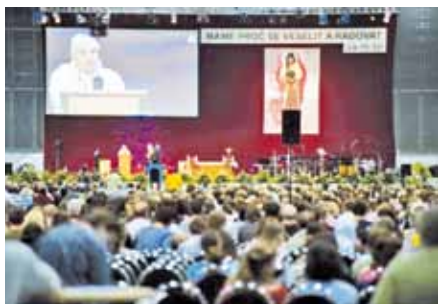
Katolická charismatická konference v Brně 2012