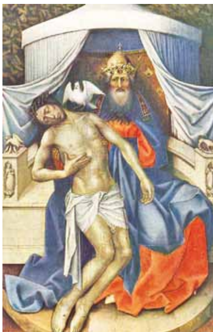
Robert Campin: Svatá Trojice (1433).