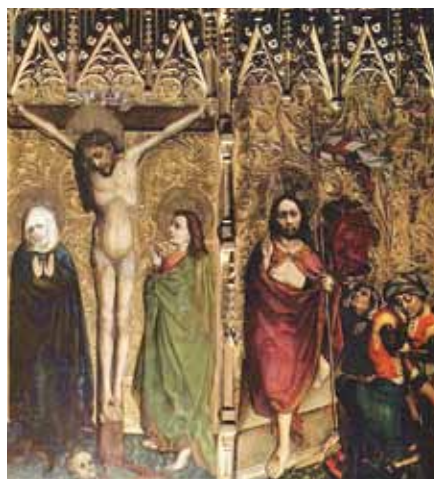
Mistr Tucherova oltář: Ukřižování a zmrtvýchvstání (1440–1450).

jenom výsledkem našeho úsilí, ale bude spíše darem, kterého se nám dostane shůry a o který je třeba neustále prosit.