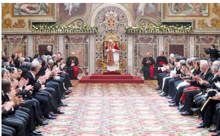
Benedikt XVI. na setkání s diplomatickým sborem.

To ale není všechno. Dne 15. prosince tentokrát vatikánská strana ohlásila, že