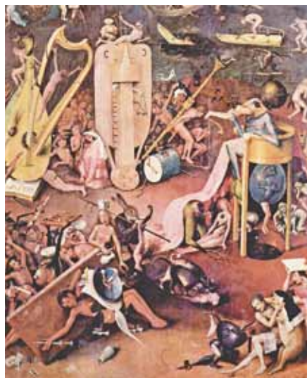
Hieronimus Bosch: Zahrada pozemských rozkoší, detail (1504).

(a samy zkoušely) jak se kondom nasazuje na model penisu (mimo chodem pan Petrnoušek pracuje přímo s vibrátorem), pak mohou ještě žádat, aby jejich dítě bylo tohoto „peer programu“ ušetřeno. Mají k tomu oporu v čl. 32, odst. 4 Listiny