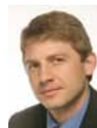
Ing. Petr Mach, Ph.D., český ekonom a politik, dřívější poradce Václava Klause, nyní předseda Strany svobodných občanů