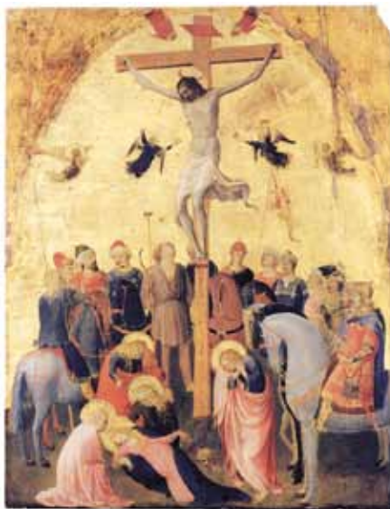
Fra Angelico: Ukřižování (1420): Foto: Wikipedia

Ježíš se setkává se třemi muži (Lk 9,51–62) a v jejich stejně jako v jeho odpovědích se zrcadlí, co znamená následování, co představuje kněžství . Především je nápadné, že muži, který se Ježíšovi vnucuje a sám se rozhoduje pro následování, dává Ježíš odmítavou odpověď. Chce tím říci: následování, nebo, klidně to nazýváme pravým jménem: kněžství, si člověk nevybírá sám. Nemůže si ho vymyslet jako nějaký způsob, jak dosáhnout životní jistoty, jak si vydělávat na svůj chléb, získat nějaké společenské postavení. Člověk si ho prostě nemůže vybrat jako něco, čím si zajistí jistotu, přátelství, bezpečnost; jak by si rád vybudoval svůj život. Nikdy to nemůže být pouhé vlastní zabezpečení, vlastní volba. Kněžství, je-li pravé, si člověk nemůže dát sám, ani je sám hledat. Může být jen odpovědí na jeho vůli a na jeho volání. Vždy to vyžaduje to, že se vzdáme své vlastní vůle, pouhé představy o sebeuskutečnění a toho, co bychom mohli udělat a chtěli mít, a vydáme se jiné vůli, abychom se jí nechali vést – a to i tam, kam nechceme. Není-li tu tato základní vůle vejít do jiné vůle, být s ní jedno, dát se vést, kam jsme si to nevypočítali, pak člověk nevstoupil na kněžskou cestu a stane se mu to osudným. Kněžství spočívá v tom, že člověk má odvahu říci ano druhé vůli, dát odpověď, aby tak ovšem krok za krokem přijímal stále větší jistotu, že my, odevzdání do této vůle, ne-