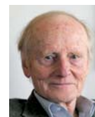
Prof. Dr. Robert Spaemann (*1927), německý katolický filosof, přítel Benedikta XVI.