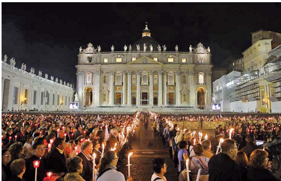
Světelný průvod, jenž byl součástí oslav 50. výročí Druhého vatikánského koncilu.

[v německém originále je použit velmi vulgární výraz, pozn. překl.], neprotestoval nikdo. Má tohle také nějakou souvislost s duchem Druhého vatikánského koncilu?