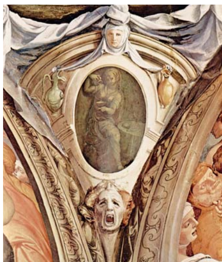
Angelo Bronzino: Temperantia (1541)

Ti, kdo poukáží na homosexuální pedofilii, nebo nesouhlasí s představováním homosexuálních rodin svým dětem v mateřské školce, jsou udáváni a obžalováni z pomluv či jiných zástupných přestupků.