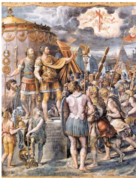
Raffaello Santi: Zjevení kříže (1520–1524).

Z teologického hlediska má ona událost všechny rysy soukromého zjevení.