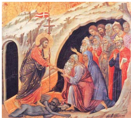
Duccio di Buoninsegna: Sestoupení do pekel (1311)

Z čítanky „Víra Církve“ sestavené z textů Josepha Ratzingera