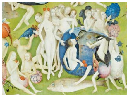
Hieronymus Bosch: Zahrada pozemských slasti, detail (1504).

Během vývoje se tyto hranice mohou posunovat, ale není to vždy společnosti ku prospěchu. Někdy v druhé polovině minulého století začala tzv. sexuální revoluce. Intimní oblast, která byla dříve ukrývána, se dostala na výsluní a sex byl degradován na zábavu. To vše pod hlavičkou odstranění pokrytectví.