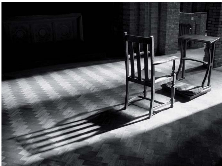
Jedním zadkem nelze sedět na dvou posvíceních.

K takovému počínání máme pomocníka. Je jím Prostředník mezi Bohem a lidmi, a jestliže v nás hoří plamen pravé lásky k němu, pomůže nám, abychom všeho dosáhli rychleji. Neboť on žije a kraluje s Otcem a Svatým Duchem, Bůh na věky věků. Amen.