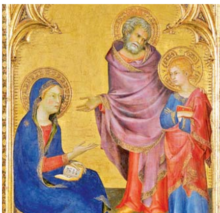
Simone Martini: Nalezení v chrámu (1342)

Toto je očividně prvořadý úkol laiků, a to nejen proto, že uzavírají svátost manželství. Snad jedním z největších povolání, jež laici musí objevit, je to, že prostřednictvím manželství nežijí jen pro sebe,