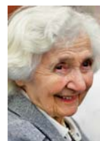
Alice von Hildebrand (*1923), katolická filosofka a teoložka