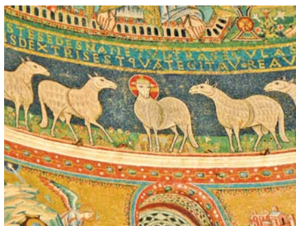
Beránek Boží, Santa Maria in Trastevere, Řím (13. stol.)

slnost či bolest svázanou s každodenním shonem. Běžec hledící na metu nemyslí na únavu. Dovede v sobě najít dodatečnou energii, aby ještě zrychlil. Pokud pozemské problémy vztahujeme k hlavnímu cíli našeho putování, pak je překonáváme ještě s větší energií a motivací!