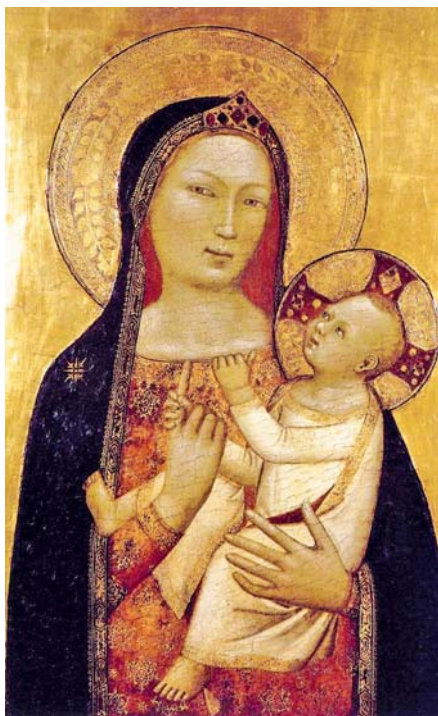
Bernardo Daddi: Madona s Dítětem (1340)

Biblické víře je vlastní, že věří v živého Boha. Bůh je živý, to znamená: je to jednající, naslouchající a promlouvající Bůh. Je Stvořitel. Pochází od něho veškerenstvo. Také však jednal v lidských dějinách a v nich ukázal svou tvář do té míry, že ve vtělení Syna sám vstoupil do dějin. Stvořením se mu veškerenstvo nevymklo z rukou. Není žádným svévolným Bohem. Respektuje zákony stvoření a svobodu člověka, které sám ustanovil. Není však také žádným bezmocným Bohem, jenž by se měl stáhnout pouze do „duchovní“, „existenciální“ oblasti. Bůh, který by nemohl působit na hmotu, by byl bezmocný Bůh – hmotu by byla sférou vyňatou z Božího jednání. Tato představa je radikálně proti biblické víře, kterou vyznání Církve zřetelně vyslovuje. Upírá koneckonců Bohu být Bohem ( Gottsein ). Proto se z pohledu víry Církve nezdá zvláštní, nýbrž naopak důsledné a jednoznačné, že Bůh ve svém ústředním dějinném jednání – při vtělení, smrti a vzkříšení Pána – pro-