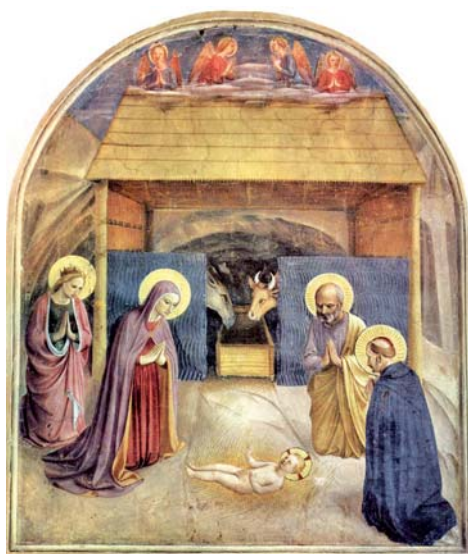
fra Angelico: Adorace Dítěte (1443).