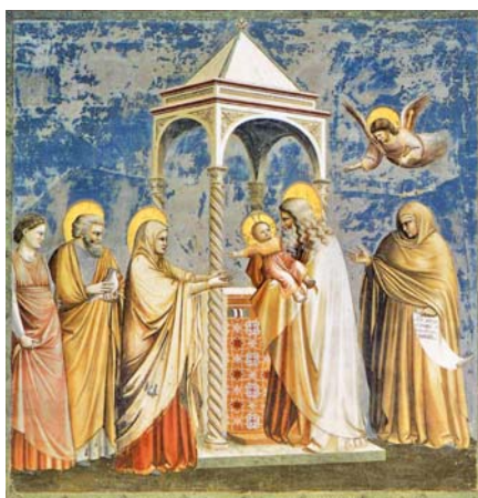
Giotto di Bondone: Uvedení Páně do chrámu (1306)

ty spásy – cesta pouhé mravnosti, velice subjektivně měřené, pro ty, kteří stojí mimo Církev, a cesta v Církvě. Nemůže mít pocit, že zamířil na tu příjemnější – v každém případě je jeho víra citelně zatížena existencí jakési cesty spásy, vystavěné vně Církve. Je zřejmé, že touto vnitřní nejistotou nejsilněji trpí misijnářská průbojnost Církve.