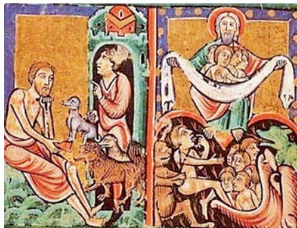
Podobenství o boháči a Lazarovi, Madrid (1436)

Rád bych v závěru své myšlenky ještě více objasnil pomocí krátkého výkladu dvou textů z Písma, ve kterých rozpoznáme stanovisko k této problematice. Prvním je složitý a tíživý úryvek, ve kterém je zvláště důrazně vyjádřen protiklad nemnohých a mnohých: „Mnoho je totiž povoláných, ale málo vyvolených“ (Mt 22,14).