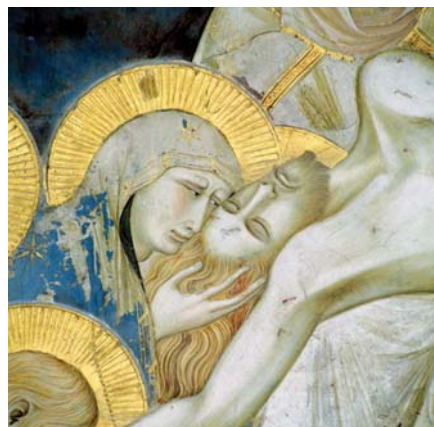
Pietro Lorenzetti: Snímání z kříže, detail (1320)

V evangeliu čteme srdceryvné líčení toho, že zatímco Kristus potil krev v Getsemanech, jeho tři milovaní učedníci tvrdě spali. Když však předtím Kristus