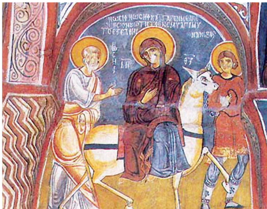
Cesta do Betléma, Kappadokie (10. století).

Hledej zásluhu, hledej příčinu, hledej spravedlnost; a dívej se pozorně, zda najdeš něco jiného nežli milost.