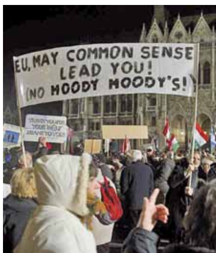
„Pochoď míru“ na podporu vlády premiéra Viktora Orbána

Jedním z těchto obvinění je Zákon o církvích. Cílem tohoto zákona je zbavit církevního statusu církev založené na byznysu. Důvodem je to, že na rozdíl od mnoha evropských zemí mají v Maďarsku církevní vzdělávací, zdravotnická a sociální zařízení zaručeno financování státem stejným způsobem, jako jsou financovány podobné státní instituce, neboť poskytují vzdělávací nebo zdravot-