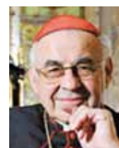
PhDr. Miloslav kardinál Vlk, český katolický duchovní a teolog, emeritní arcibiskup pražský