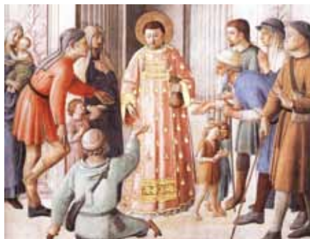
Fra Angelico: Svatý Vavřinec rozdává almužnu (1450)

Tento výraz z Listu Židům nás nutí k tomu, abychom uvažovali o univerzálním povolání ke svatosti a stálosti cesty v duchovním životě, abychom usilovali