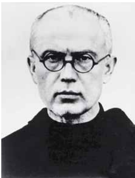
Svatý Maxmilián Kolbe.

Svatý Maxmilián Kolbe nám může být příkladem neochvějné věrnosti víře a obětavé lásky, která si nevybírá, ale dává se za všechny.