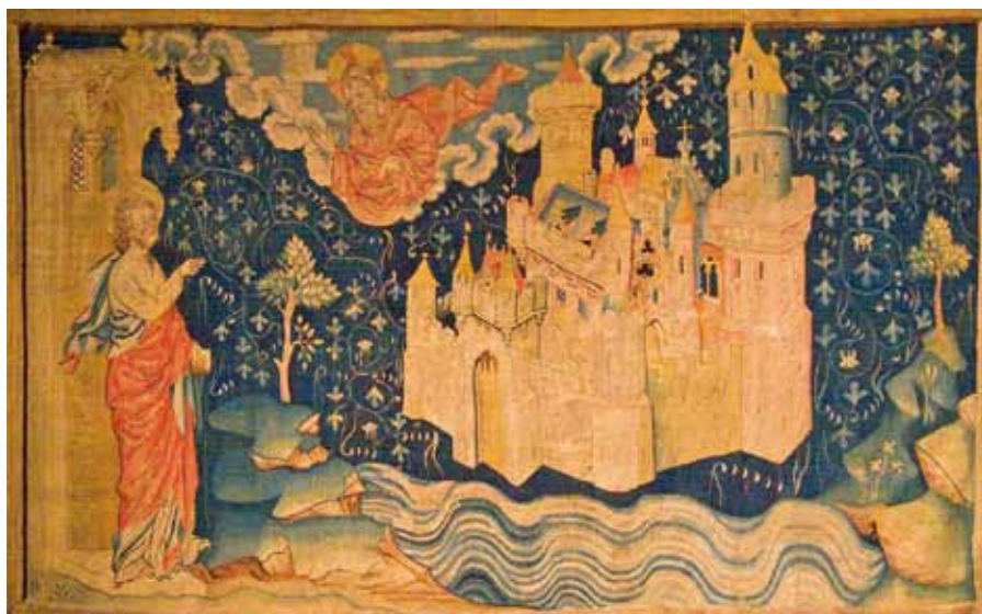
Nebeský Jeruzalém, Tapiserie Apokalypsy (14. stol.).

Chystejte se tedy – buďte připraveni. Nejde o to, abyste si oblékli krásná bílá roucha, ale čisté svědomí a dobrou duši.