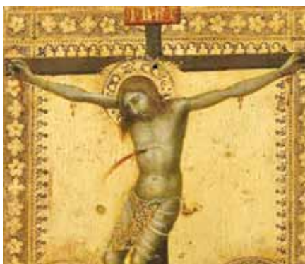
Naddo Ceccarelli: Ukřížování, detail (14. stol.)

Křesťanská víra změnila svět. Neudělala z něho ráj, v němž by nám už předem