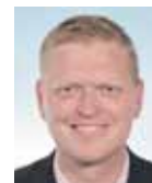
MVDr. Pavel Bělobrádek Ph.D. předseda KDU-ČSL