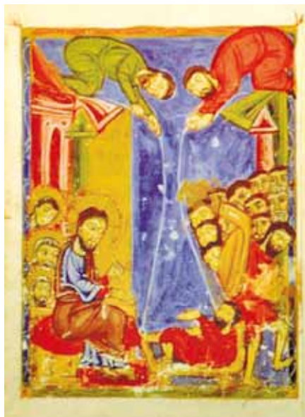
Ježíš odpouští hříchy ochrnulému

Rodič: Asi máš pravdu. Ale také je třeba si uvědomit, že nikdo z lidí nemohl od-