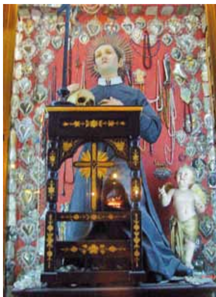
Svatý Gerard Majella, patron nenarozených dětí

většinu z nich osvěta ani prevence nezastaví. Vědí vše, co vědět chtějí.“ Proč pak ale podobné akce pořádat, když nikoho nepřesvědčí? Já myslím, že jsou třeba!