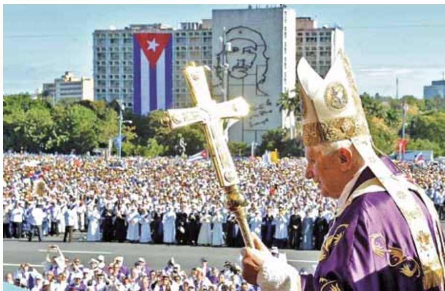
Benedikt XVI. v Havaně.

Pravda o člověku je navíc nevyhnutelným předpokladem k dosažení svobody, protože v ní objevujeme základy etiky, s níž se mohou všichni měřit a která obsahuje jasné a přesné formulace o životě a smrti,