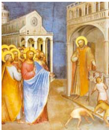
Giusto de' Menabuoi: Ježíš povolává Léviho (1378)

Rodič: Všimni si toho, že Pán Ježíš nepopírá, že celníci jsou hříšníci. Zdůrazňuje, že se celníci mohou nechat uzdravit – Lévi to udělal. Ježíš k tomu říká: „Lékaře nepotřebují spravedliví, ale hříšníci.“