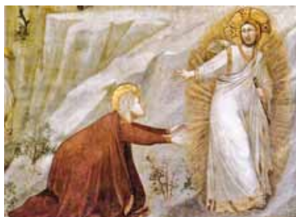
Giotto di Bondone: Noli me tangere, detail (1320)

něčeho zcela jiného, nového světa zmrtvýchvstání, jazykovými prostředky a představami našeho světa. Odtud se vysvětluje zvláštní zlomkovitost zpráv o zmrtvýchvstání a také jejich právě zmíněná částečná