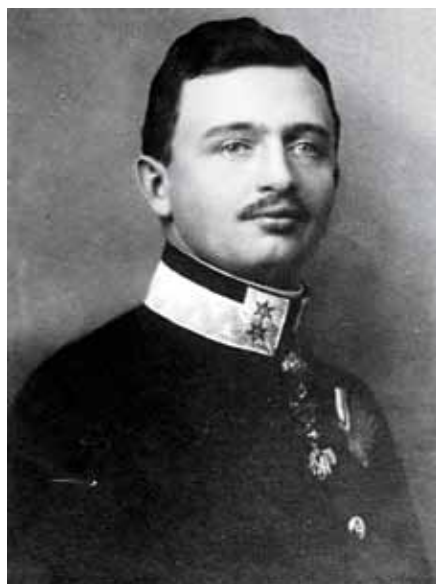
Blahoslavený Karel I. Habsburský.

Karel se narodil 17. srpna 1887 jako první syn arcivévody Oty Habsburského a Marie Josefy ze saské dynastie. Manželství Oty a Marie nebylo zrovna šťastné. Vnitřní konflikt duchovní povahy mezi