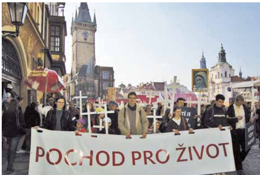
XII. Pochod pro život.

V Praze se uskutečnil XII. Pochod pro život