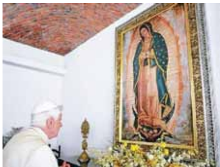
Benedikt XVI. při modlitbě k Panně Marii Guadalupe, patronce Mexika.