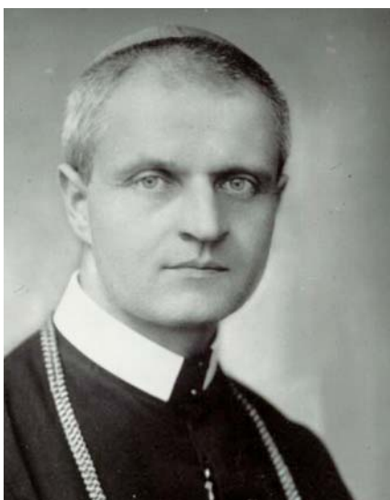
Blahoslavený Pavol Peter Gojdič OSBM.

nižován a vystaven brutalitě a násilí dozorců. Když například dozorcí v Leopoldově na otázku kým je, odpověděl, že je řeckokatolický biskup, musel udělat padesát dřepů. Když padl únavou na zem, byl bachařem zkopán. Často byl izolován na samotkách. Svě utrpení přijímal s velkou pokorou a trpělivostí: „Všechno utrpení, které jsem doposud snášel, jsem přijal rád, a bolí mě pouze to, že mnozí věřící