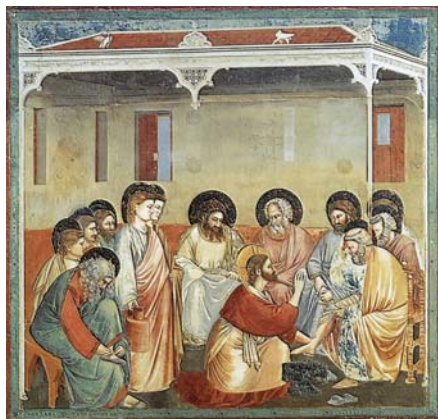
Giotto di Bondone: Kristus myje nohy apoštolům (1305)

Z čítanky „Víra Církve“ sestavené z textů Josepha Ratzingera