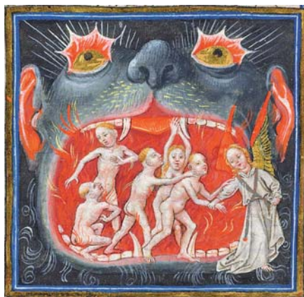
Kniha hodin Kateřiny Kleveské (1440).