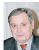
Dr. Vittorio Messori (* 1941), přední italský katolický politolog, novinář a spisovatel