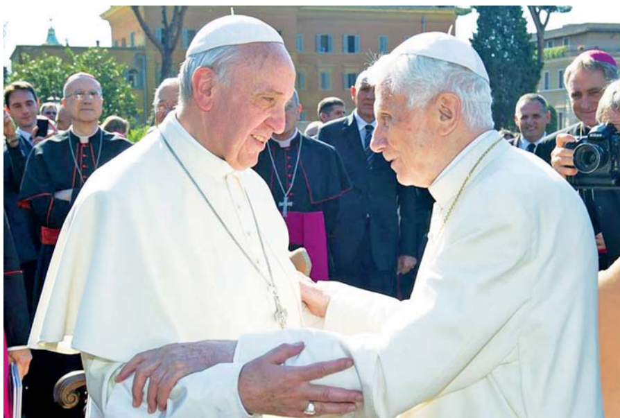
Papež František a emeritní papež Benedikt XVI.

Nová encyklika Lumen fidei jako dílo dvou papežů