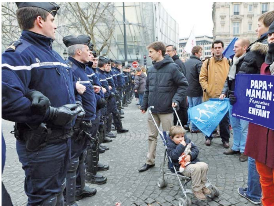
Poučení už nemusíme hledat jen v Kanadě – stačí se podívat do Francie.

nedávno odebral kanadské komisi pro lidská práva statutární soudní pravomoc za šíření „nenávisných projevů“.