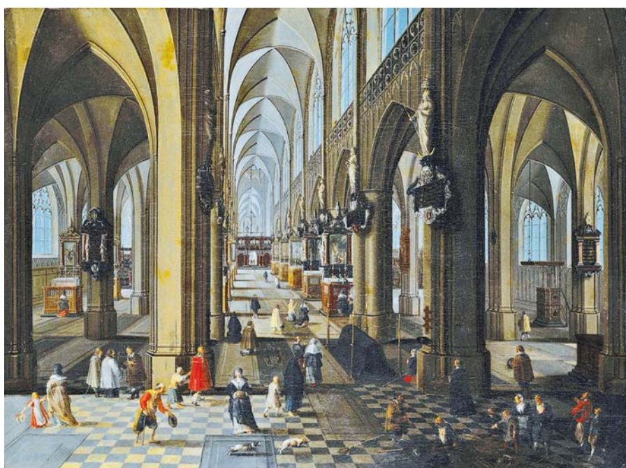
Peeter Neefs starší: Interiér antwerpské katedrály (1651).

Takže je zřejmé, že kdyby neviděli Ježíše zmrtevýchvalého a kdyby se jim nedostalo přesvědčivého důkazu jeho moci, nebyli by se rozhodli pro tak veliké dílo.