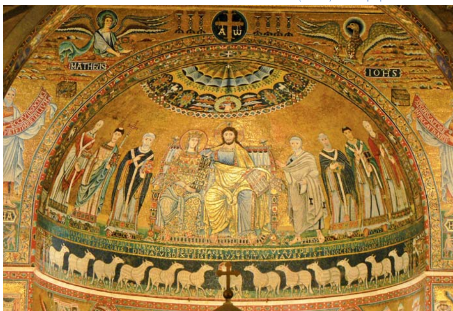
Pietro Cavallini: Kristus na trůnu (ca 1290).

obrácení syna! A kolik matek i dnes prolévá slzy, aby se jejich děti vrátily ke Kristu! Neztrácejte naději v milost Boží! Ve Vyznáních čteme větu, kterou jistý biskup řekl svatě Monice, která prosila za svého syna, aby našel cestu víry: „Není možné, aby syn tolika slz zahynul“ (III,12,21). Sám Augustin se po své konverzi obrací k Bohu slovy: „Z lásky ke mně plakala před tebou má matka naplněna vírou a prolila více slz, než kolik jich prolíjí matky nad fyzickou smrtí svých dětí“ ( ibid. , III,11,19). A tato neklidná žena mohla nakonec pronést nádherná slova: Cumulatius hoc mihi Deus praestitit! Bůh jí hojně vynahradil, co oplakala! A Augustin je dědicem Moniky, od níž obdržel onen zárodek neklidu. Je to neklid lásky: hledat vždy a bez ustání dobro toho druhého, milovaného člověka, s onou intenzitou, která přivádí až k slzám. Vybavuje se mi Ježíš, jak pláče u hrobu přítele Lazara; Petr, který se po zapření Ježíše setkal s jeho pohledem oplývajícím milosrdenstvím a láskou a hořce zaplakal; otec, který vyhlíží na zápraží návrat syna a když jej v dále spatří, běží mu vstříc; vybavuje se mi Panna Maria, která s láskou následuje Syna Ježíše až pod kříž. Jak jsme na tom my s neklidem lásky? Věříme v lásku k Bohu a k druhým? Anebo jsme v tomto bodě nominalisty? Nikoli abstraktně, nejenom slova, ale konkrétního bratra potkáváme; bratra, který je vedle nás. Necháváme se