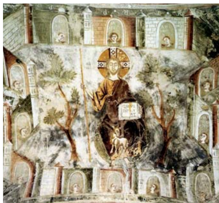
Nebeský Jeruzalém, San Pietro al Monte, Civitate (cca 1090)

Z čítanky „Víra Církve“ sestavené z textů Josepha Ratzingera