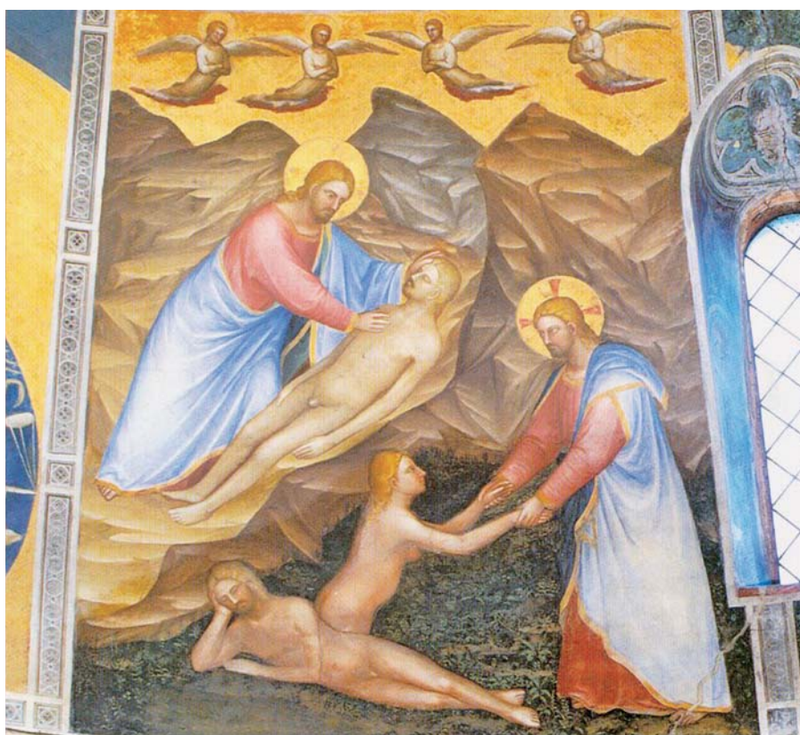
Giusto di Giovanni de' Menabuoi: Svoření Adama a Evy (1370).

Volá však zbloudilé zpátky. Vždyť i u olomených větvích apoštol říká: Bůh je dost mocný, aby je znovu narouboval. Ať už mluvíme o ovcích, které zabloudily od stáda, nebo o větvích odříznutých od kmene révy, Bůh má jistě stejnou moc zavolat ovce zpátky i naroubovat ratolesti znovu na kmen; je přece nejvyšší pastýř a je pravý vinař.