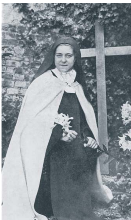
Svatá Terezie z Lisieux (červenec 1896).

„Malá“ světice i v rámci karmelského kontemplativního života hledala své osobní poslání relativně dlouho, sama a velmi poctivě. Tázala se svých tužeb a Krista, čím má být. Ta, která si jako děvčátko před hromadou hraček nemohla vybrat a prohlásila, že chce všech-