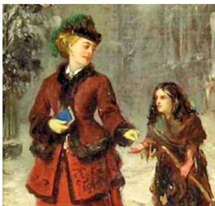
Edward Charles Barnes: Malá žebračka.

na dítě 13 404 Kč a na plátce nebo jeho manželku 24 840 Kč. MF ČR tak ekonomicky z hlediska daní definuje dítě jako poločlověka. Navíc lze konstatovat z pohledu lékařského schizofrenní stav mezi dvěma důležitými státními institucemi, MF ČR a ČSÚ. Každá z těchto důležitých státních institucí vidí jiné, diametrálně odlišné dítě. Statistika ČSÚ vidí dítě v realu. Ekonomové z MF ČR vidí dítě ve zmenšeném modelu 1 : 6, což přesně odpovídá daňové slevě na dítě ve výši 16,7 % skutečných nákladů na výchovu dítěte v rodině.