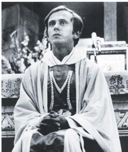
Jerzy Popiełuszko.

Po maturitě vstoupil Jerzy do semináře ve Varšavě, kterým tehdejší režim udržoval alespoň iluzi o náboženské svobodě. Hned po prvním roce studia musel Jerzy na vojnu. Kněžské svěcení přijal 28. května 1972 z rukou samotného kardinála Stefana Wyszyńskiho a 11. června téhož roku konečně mohl odsloužit svou primiční mši. Na zadní stranu primičních obrázků si nechal vytisknout: „Bůh mě