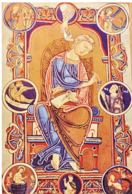
Svatý Jan evangelista.

Z čítanky „Víra Církve“ sestavené z textů Josepha Ratzingera