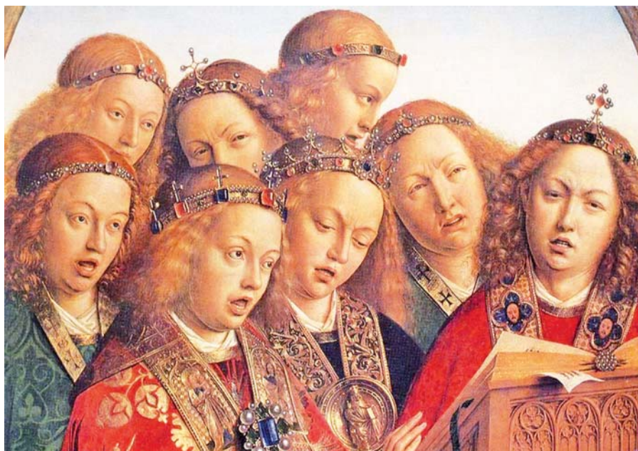
Jan van Eyck: Gentský oltář: žijící andělé, detail (1429).

Proto nás Církev v této posvátné době, jako dobrá matka pečující o naši spásu, učí hymny, chvalozpěvy i jinými slovy pocházejícími od Ducha Svatého a posvátnými obřady, jakým způsobem máme s věčnou myslí přijímat tak velké dobrodiní a obohacovat se jeho plody.