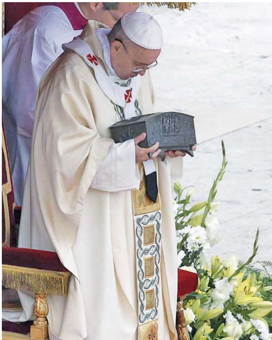
Papež František při modlitbě nad ostatky svatého Petra.

Petr ve Františkově objetí. Obraz, který jistě najde místo v obrazových dějinách tohoto pontifikátu. Na zakončení Roku víry byly na náměstí sv. Petra vystaveny k veřejné poctě relikvie Rybáře z Galileje, totiž ta jejich část, kterou si Pavel VI. v roce 1970 vyžádal pro soukromou papežskou kapli v Apoštolském paláci. Když mše dospěla k vyznání víry, František uchopil urnu s Petrovými kostmi do rukou a tak recitoval Krédo. Jako by se i on chtěl opřít o Petrovu víru, být od něho utvrzen ve víře.