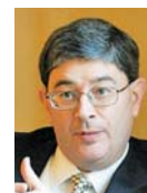
George Weigel (*1951), katolický teolog a čestný člen Centra pro etiku a veřejnou politiku ve Washingtonu, D. C.