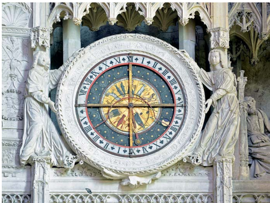
Astronomické hodiny, katedrála Notre Dame v Chartres.

Čiňme tedy pokání z celého srdce, ať nikdo z nás nezahyne. Pomáhejme si navzájem, abychom i ty, kdo jsou slabí, přiváděli k dobrému, abychom tak byli zachráněni všichni, a vzájemně se obračejme a povzbuzujme.