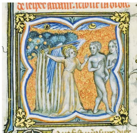
Vyhánění z ráje.

Z čítanky „Víra Církve“ sestavené z textů Josepha Ratzingera