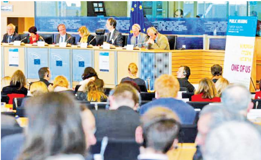
Veřejné slyšení v Evropském parlamentu k iniciativě „Jeden z nás“.

jako je mateřství, vztah matka-dítě, respekt k právům rodičů či právo na výhradu svědomí jsou některými europoslanci nekompromisně odmítána.