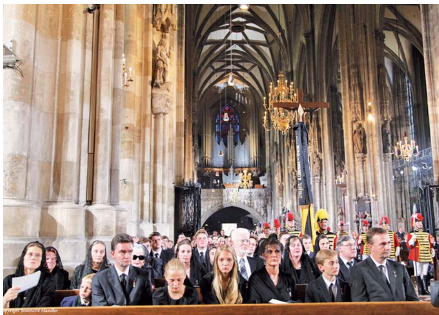
Relikviem za Ottu von Habsburka.

Stejně jako nemůže zůstat beránek mezi vlky nedotčený, není si jist ani spravedlivý mezi hříšníky. Hříšník totiž usiluje spravedlivému o život nejruznějšími intrikami, vylslechy, léčkami, trýzněním, vražděním.