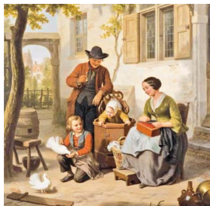
Basile de Looze: Šťastná rodina (1856)

Začnu složitější položkou, a tou je sociální pojištění (SP). Zaměstnanec odvede „za sebe“ 6,5 % na důchodové pojištění a „za zaměstnavatele“ 25 % jako sociální