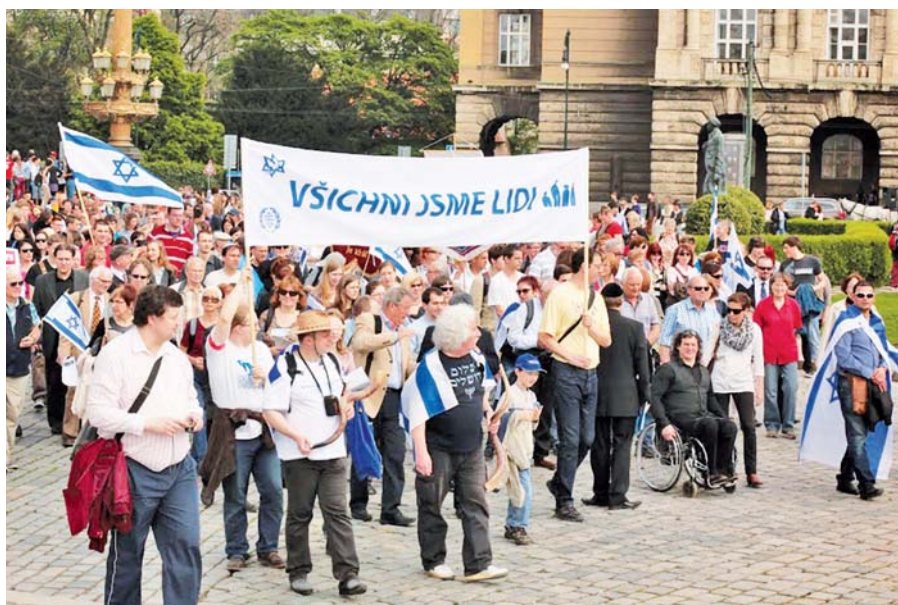
Fotografie na této straně: Pochod dobré vůle 2014.

Jako organizátora happeningu PAMATUJ! na oběti největší hromadné vraždy v historii České republiky mě velmi zajímalo, jak proběhne letošní 11. ročník Pochodu dobré vůle s titulem Kulturou proti antisemitismu, pořádaný Křesťanským velvyslanectvím Jeruzalém v Praze ICEJ pod záštitou místopředsedy senátu Parlamentu ČR pana Přemysla Sobotky, ministra kultury Daniela Hermana a primátora hl. m. Prahy Tomáše Hudečka, za podpory hl. m. Prahy a nadace Konrada Adenauera.