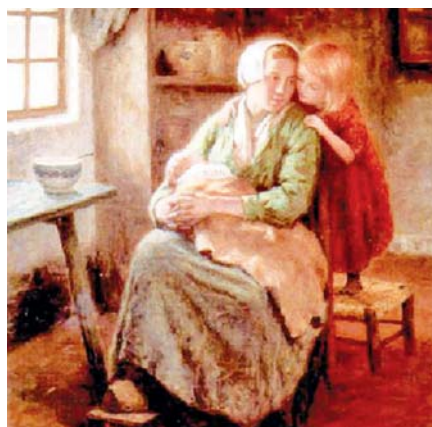
Hendrik Heyligers: Mateřská láska (1877–1879)

Tentokrát se spolu podíváme pod drobnohledem na tzv. výplatní pásku. Pokud obsahuje úplné vyúčtování vaší mzdy, tak na ní najdete úplné mzdové náklady (superhrubou mzdu), sociální a zdravotní pojištění placené zaměstnavatelem, hrubou mzdu, sociální a zdravotní pojištění placené zaměstnancem, slevy na dani (paušál 2 070 Kč měsíčně, tj. 24 840 Kč ročně na poplatníka) a zá-