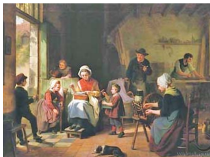
Basile de Loose: Rodina při práci. Foto: Wikigallery

Konzumní rodiče vedou rozdělený život. V práci žijí jako lidé, kteří něco vytvářejí, ale doma jako konzumenti. Jejich dětem tudíž připadá, že rodiče pracují pouze proto, aby mohli konzumovat. Jejich domov, velice vzdálený od reálného světa zodpovědného dospělého člověka a etických mezilidských vztahů, je mís-