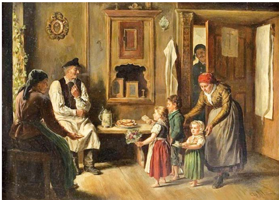
Basile de Looze: Gratulace (1809–1885).

Průběžné financování je proto velmi citlivé na demografický vývoj nebo, řečeno jasněji, nevychováš řádně děti, budoucí plátce daní? Pak ti nemá kdo přispívat na tvůj důchod! Nebo jej chceš od dětí cizích lidí? Děti, na jejichž výchovu jsi jako bezdětný přispíval nedostatečně!