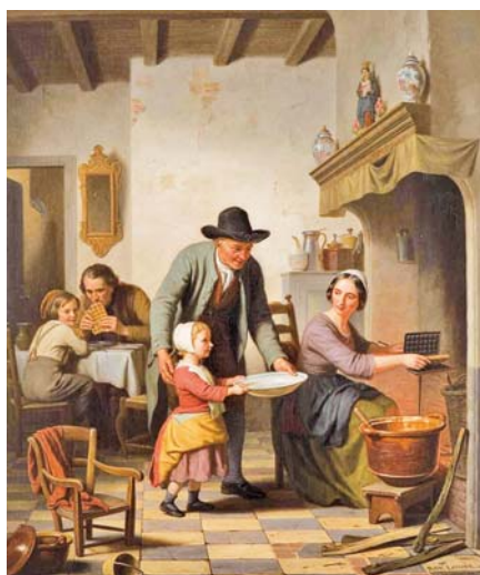
Basile de Loose: Pečení vafelí (1853).