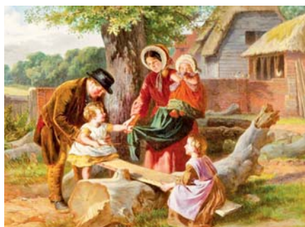
William Henry Knight: Na houpačce (1823–1863)

propaganda v naprostém rozporu se skutečností přesvědčuje bezdětné, že doplácí na výchovu vašich dětí! Neznám větší lež, než je právě tato. Vy, pracující rodiče dětí, odvedete státu téměř polovinu ze své úplné mzdy, kterou má pro vás připravenou zaměstnavatel a od státu dostanete na dvě děti pouhý zlomek částky, která vám byla sebrána na daních, ať se jim říká skutečně daň, nebo záměrně nesprávně pojištění.