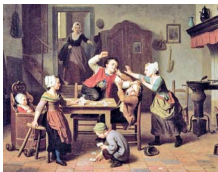
Basile de Loose: Malí karbaníci (1868)

Na první pohled většina dětí z konzumních rodin nevypadá, že by měla vážné problémy. Bývají veselé a dobře naladěné, příjemné a usmívají se, často jsou velmi aktivní – ale jen v činnostech, které je baví. Jsou zvyklé na příjemné pocity. Líbí se jim, když je lidé mají rádi, a vlastně očekávají, že je lidé budou mít rádi bez