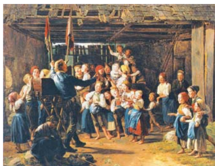
Ferdinand Georg Waldmüller: Potulný bavič (1847)

dý si užívá hojných potěšení úspěšného životního stylu. Přesto později v dospívání a rané dospělosti jejich životy pustoší alkohol a jiné drogy, bolestný a trvalý manželský nesoulad, dětinská nezodpovědnost, nedostatek ideálů, či dokonce životních cílů, bezcílnost a nestabilita v zaměstnání, bezohledná honba za rozkošemi, problémy se zákonem, nejasné pochybnosti o sobě samých a sebenenávist, dokonce i vraždy a sebevraždy.