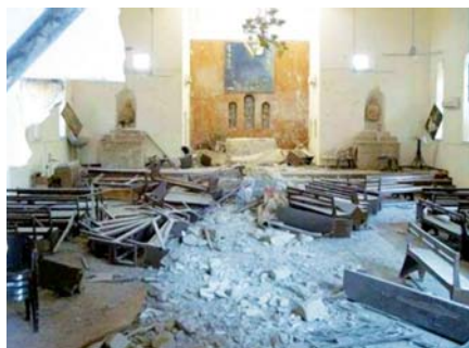
Kostel v Mosúlu.

Libanonský velký muftí, šejk Muhammad Rašíd Kabbání, vyzval o svátku Eid al-Fitr ke svaté válce za osvobození Palestiny; tento džihád je povinností každého muslima. Na druhou stranu muftí odmítl protikřesťanské násilí v Iráku a prohlásil, že toto násilí je proti principům islámu.