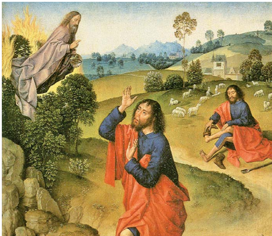
Dirk Bouts: Mojžiš a hořící keř (1450–1475).

Katecheze Svatého otce Františka na generální audienci