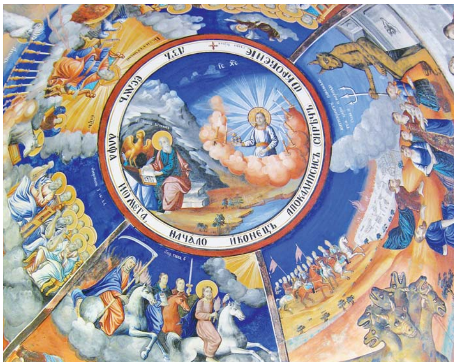
Apokalypsa, klášter Osogovo, Makedonie. Foto: Edal/Anton Lefterov, Wikipedia

Toto všechno, co jsem uvedl, skládá dohromady královskou korunu. Bez toho nikdo nemůže vládnout zde na zemi ani dopředu do království věčného.