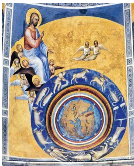
Giusto de' Menabuoi: Stvoření světa (1378)

„plod země a plod lidské práce“. Když se trochu zamyslíme, zahrnuje to v sobě proměnu ekonomie: chléb, který přichází na stůl a který má být z čisté pšenice, nemůže být míšen s pesticidy, nesmí být produkován v mrzkých podmínkách. Jinak by náš dar byl urážkou! Nemluvě o nezbytných podmínkách výroby „dobrého“ mešního vína. Tímto jednoduchým požadavkem, že je třeba přinášet dary důstojné oltáře, lze zpochybnit celou ekonomii.