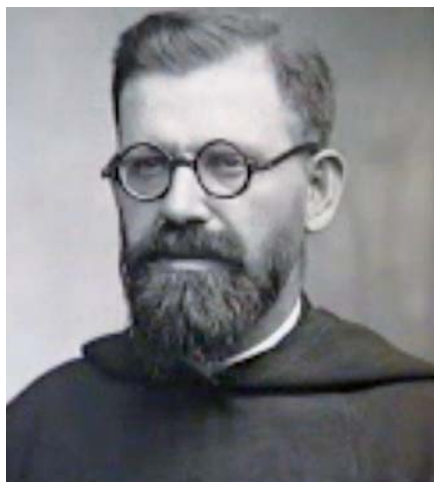
Blahoslavený Josafat Šiškov

rád zpíval. Aby se přiblížil mladým a přivedl je k víře, neváhal využívat tehdy moderní technologie – pro studenty zajistil rádio a promítačku, aby jim mohl promítat grotesky či dětské příběhy. V době jeho působení došlo k rozvoji semináře v Jambolu. Věnoval se bohoslovcům latinského i byzantsko-slovanského ritu, pro něž sloužil mši v obou rytech.