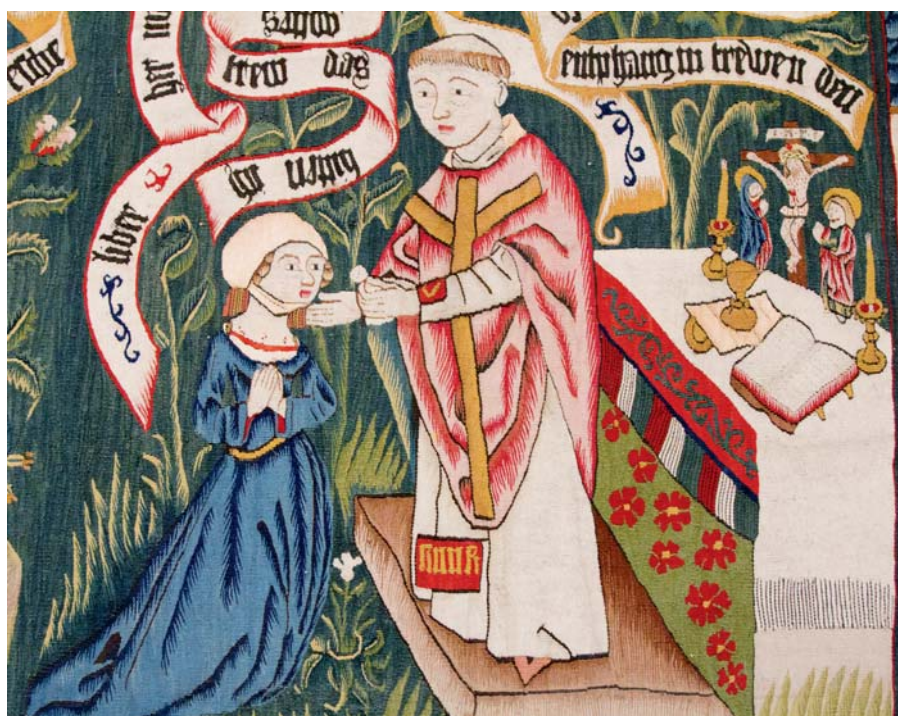
Detail středověké tapisérie (V&A Museum, Londýn).

Úzkostlivě se střežte toho, aby nepřítel někoho někde nenachytil nečinného a malátného nebo aby nějaký bludař nezmrhal cokoli z toho, co vám bylo předáno.