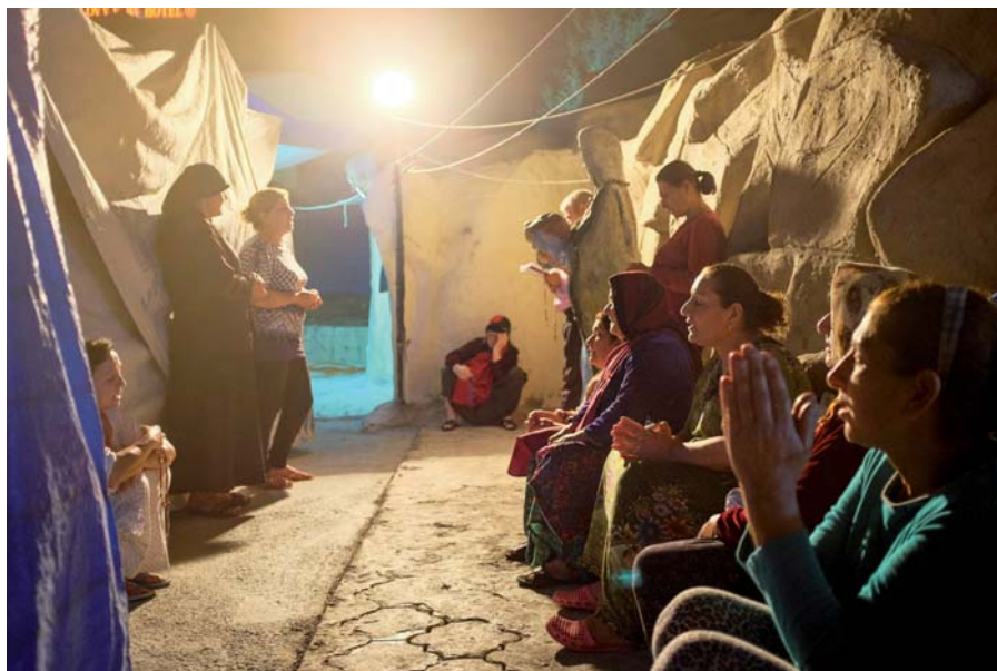
Křesťanští uprchlíci v Erbilu.

Jakou pomoc bychom jim poskytli? Kufříky pro děti na cestu do školky? To by