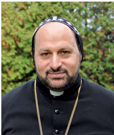
Abuna Benjamin Shamoun.

Než jsem se stal mnichem, studoval jsem matematiku na mosulské univerzitě a teologii na mosulském teologickém institutu. Po vstupu do kláštera jsem pokračoval tři roky ve studiu teologie v Egyptě, rok v Londýně a šest let jsem působil na dvou místech ve Švédsku. Kvůli řádění Islámského státu v Iráku jsem se rozhodl vrátit, abych mohl pomáhat křesťanským uprchlíkům. Patřím sice do kláštera sv. Matouše, ale v současné době se snažíme spolupracovat s organizacemi v křesťanské oblasti Ankawa na předměstí Erbilu v pomoci křesťanům. V klášteře sv. Ma-