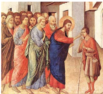
Duccio di Buoninsegna: Uzdravení slepce (1308–1311)

prosbou, nechává se strhnout jeho situací. Nespokojuje se s tím, že mu dá almužnu, ale chce se s ním osobně setkat. Nepodává směrnice, ani odpovědi, ale klade otázku: „Co chceš, abych pro tebe udělal?“ (Mk 10,51). Otázka by se mohla zdát zbytečná, vždyť co jiného by si mohl přát slepec než navrácení zraku? A přece: touto přímou, ale uctívou otázkou ukazuje Ježíš, že chce slyšet, co potřebujeme. Přeje si s každým z nás vést rozhovor, který je tvořen živo-