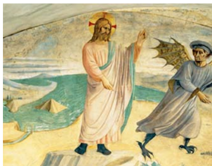
Fra Angelico: Pokušení Krista.

Za druhé doufáme, že synoda bude ctít své historické poslání a neomezí se pouze na některé pastorační otázky (např. možnost podávání přijímání rozvedeným, kteří uzavřeli nový sňatek), ale pomůže Svatému otci jasně vyslovit určité pravdy a formulovat užitečné pokyny použitelné