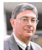
George Weigel, americký teolog, spisovatel a politický aktivista