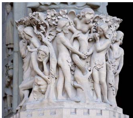
Pokoušení Adama a Evy (katedrála Notre-Dame)

Slyšela jsem, že hodně, ale to neznamená, že je to většina. Podle mého je to, jak říkáme u nás doma, „leninská menšina“. Je to menšina, která je dobře organizovaná