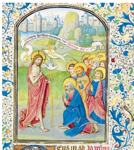
Willem Vrelant: Vyslání apoštolů (1460)