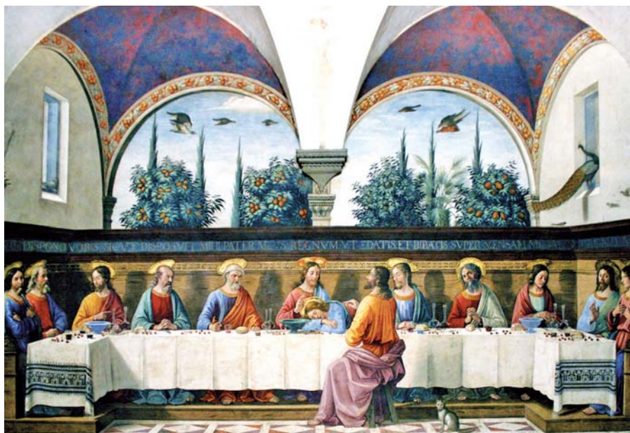
Domenico Ghirlandaio: Poslední večeře (1480). Foto: Flickr, mberry (CC BY-NC-SA 2.0)

Buď tedy, člověče, vskutku Boží obětí i Božím obětníkem. Nepromarni to, co ti dala a svěřila božská moc. Přioděj se rouchem svatosti, opásej pásem čistoty. Pokrývkou tvé hlavy ať je Kristus. Kříž ať stále spočívá na hradbě tvého čela. Na srdce si polož posvátnou pečeť Boží pravdy. Stále zapaluj vonné kadidlo modlitby. Chop se meče Ducha. A postav oltář svého srdce. Tak s důvěrou v Boha připrav své tělo k oběti. Bůh hledá víru, nikoli smrt.