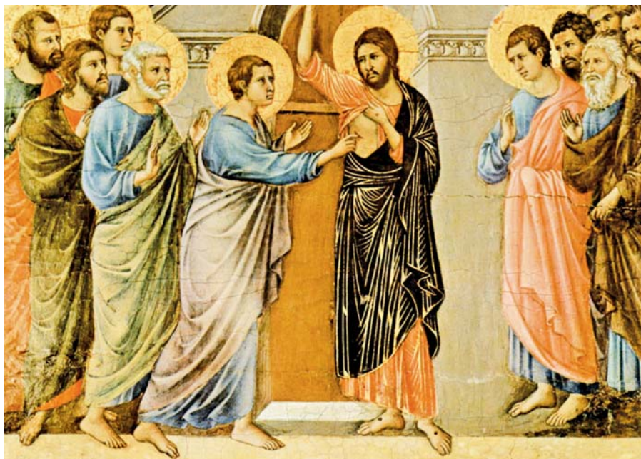
Duccio di Buoninsegna: Nevěřící Tomáš (1308–1311). Foto: Wikimedia Commons

Homilie papeže Františka v neděli Božího Milosrdenství