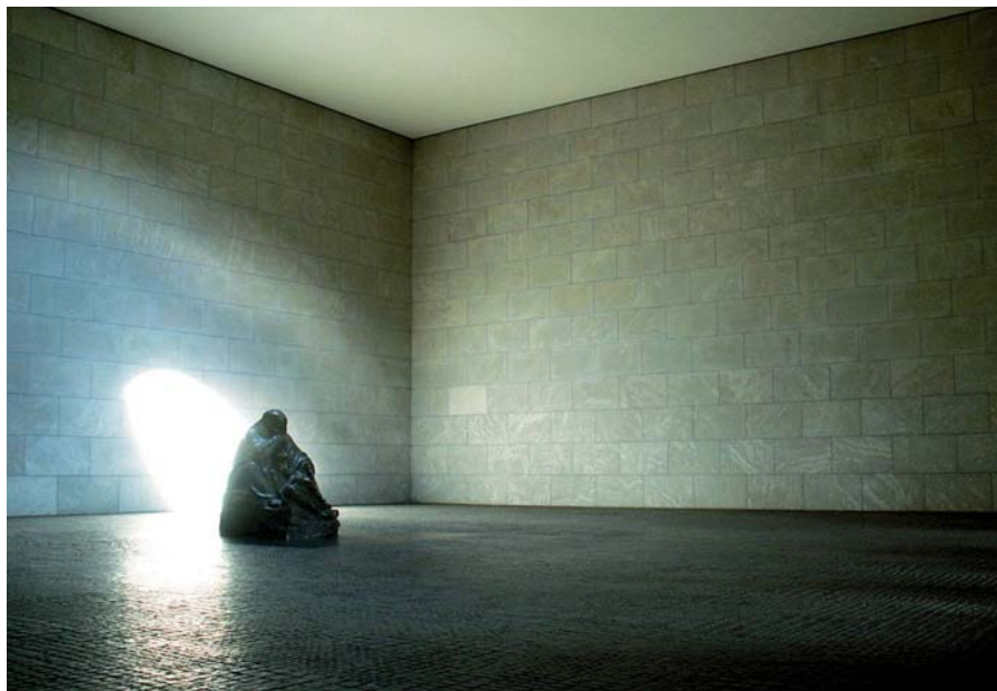
Käthe Kollwitz: Matka s mrtvým synem (1937) v Památníku obětem války a tyranie Neue Wache

kou rasistů a kázat všem obohacování jinakostí. Zdá se ale, že s tím je teď konec. Tito krasoduchové ochromili elementární funkci západních států vymáhat dodržování práva od všech (bez nadržování menšinám) a postavili manipulovanou veřejnost před hrozbu islamizace. Kdo nemá na očích ideologické klapky, vnímá tuto hrozbu jako velice reálnou; osvědčená nálepka „islamofob“ přestává fungovat.