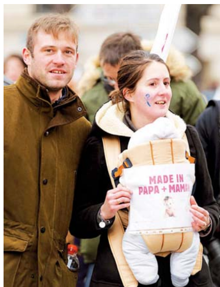
Demonstrace Manif Pour Tous.

ciálně identičtí. Muž a žena se totiž nemohou systematicky ujímat téže úlohy, ani téže symboliky, počínaje mateřstvím a otcovstvím. Tato egalitářská perspektiva pokrývá a zkomplikovala vztahy mezi dvěma pohlavími a zčásti vysvětluje, byť není jediným důvodem, proč jsou vztahy v rámci páru natolik obtížné, proč už tolik lidí nevolí manželství, nebo z něj má strach. V dějinách se vždy vracel tento