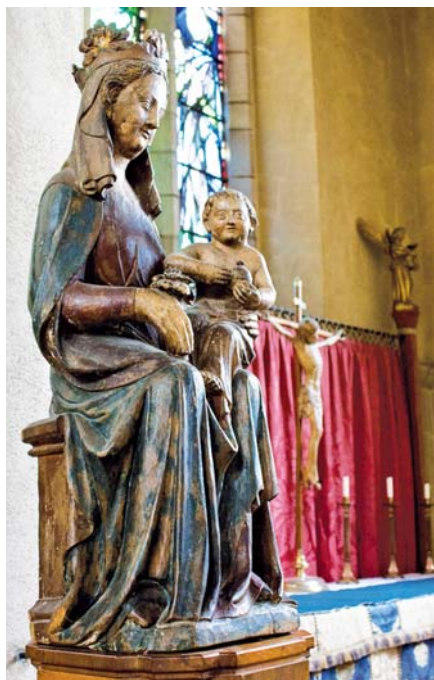
Madona s dítětem (14. stol.)

Teprve totalitní režimy dvacátého století tuto samozřejmost zpochybnily: nacisté se sice snažili různými způsoby povzbudit biologické plození, ale s nástupem války hnali ženy do válečné výroby; komunisté v očekávání třetí světové války zorganizovali podobný Totaleinsatz a vtiskli naší společnosti představu, že „práce“ je cosi, co i žena-matka vykonává mimo dům: péče o děti se do ní nepočítá.