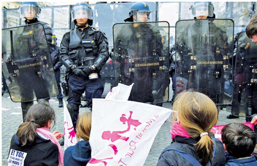
Demonstrace Manif Pour Tous.

Ve chvíli, kdy se někdo zabývá homosexualitou a polickou vůli zapsat ji do zákona za stejných podmínek, jaké mají rodina a manželství, vyhrazené výlučně muži a ženě, je okamžitě obviňován ze všeho špatného, počínaje homofobním klíší. Je to způsob, jak umlčet intelekt a zadusit debatu, a to v okamžiku, kdy se trvale hlásá, že svoboda vyjadřování je „hodnotou“ demokratických společností. Liberalismus podmíněný „etickým relativismem“ je ve svých stále restriktivnějších zákonech stejně tak represivní, jako byly totalitární