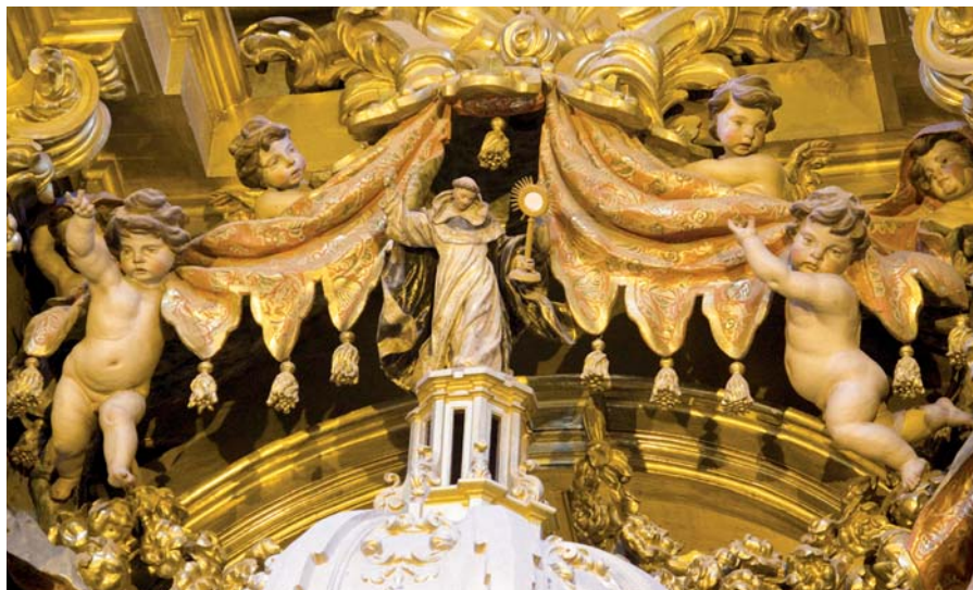
Svatý Tomáš Akvinský s monstrancí (kostel dominikánů v Salamance).

Obě strany mají společné to, že o kánonech 915 a 916 nikdy nemluví. Pokud