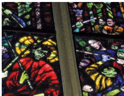
Hitler a Mussolini mezi tupiteli Krista. Detail vitráže farního kostela ve Štýrském Hradci.

Šéfiděolog německého nacismu Alfred Rosenberg ve svém spise Mýtus 20. století píše o tzv. „křesťansko-židovském moru, který musí být zničen“. Nacistická ideologie sice formálně uznávala existenci Boha, ale nejednalo se o bytost a osobu, pouze o jakousi neosobní „prozřetelnost“, která se realizuje