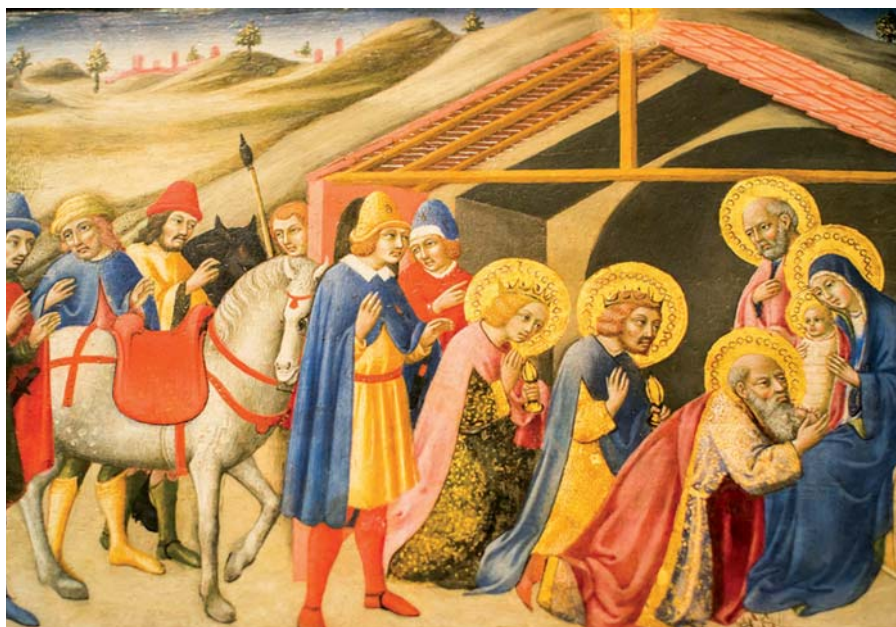
Klanění tří králů.

A tak v pravém smyslu a přiměřeným způsobem, osvícení Duchem patříme na jas Boží slávy.