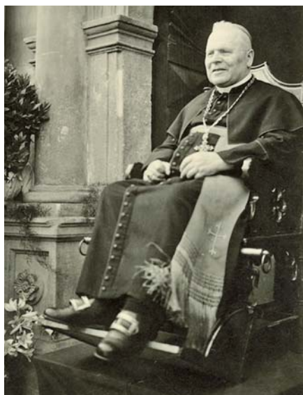
Mons. Johannes Baptist Sproll v době, kdy byl již upoután na invalidní vozík.

Ještě před nástupem Hitlera k moci roku 1933 vystupoval ostře proti nacismu. Za vlády hitlerovců bránil církevní školy, které v jeho diecézi úřady zavíraly, a vyvracel z kazatelny protikatolické štvavní nacistického tisku. Bral si na mušku zejména proticírkevní veršovánky hojně rozšiřované ve školách, např. „Ohne Gott