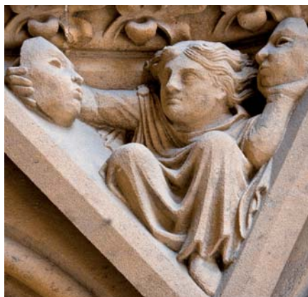
Detail výzdoby katedrály v Metách (Francie)

Na tyto charakteristiky často klademe důraz, neboť máme na mysli dobro dítěte. Takto nám však uniká podstata rodiny, a třebaže máme v úmyslu ji chránit, poskytuje zbraně k její demolici. Přílišná starost o dobro dítěte zapomíná na jeho existenci . Důraz na povinnosti rodičů