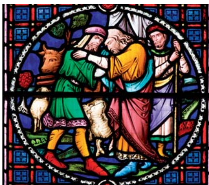
Návrat marnotratného syna. Vitráž v kostele St Mary de Castro v Leicesteru.

Některé kanonické tresty jsou „odčítající“, což znamená, že jsou určeny jako způsob, kterým se napravuje škoda způsobená prohřeškem a obnovuje se spravedlnost v životě Církve. Ale běžnějším druhem trestu jsou nápravné tresty,