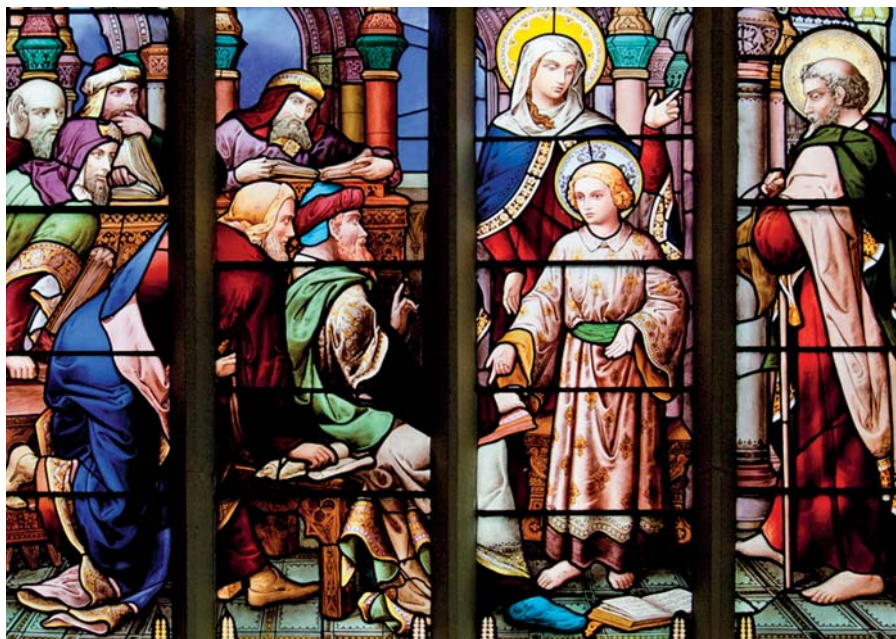
Nalezení Ježíše v chrámě. Vitráž v kostele sv. Jana Křtitele v Newcastleu.

Homilie papeže Františka při mši svaté na svátek Svaté Rodiny