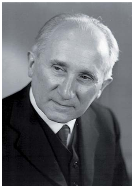
Romano Guardini.