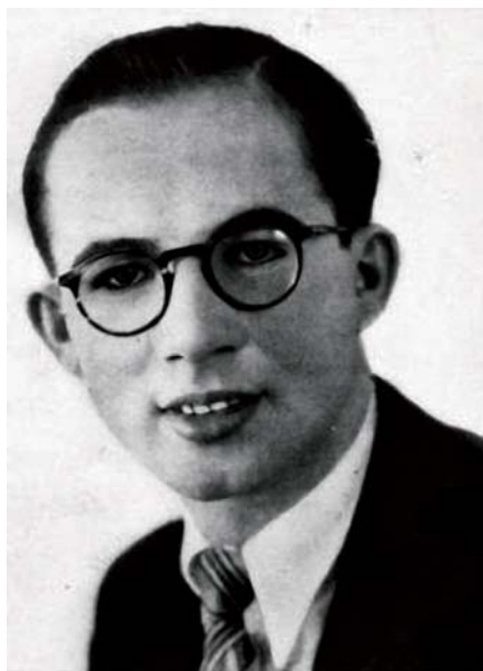
Blahoslavený Marcel Callo

tálně nasadila“ na práci v říši, konkrétně v Durynsku, kde byl spolu s jinými ubytován v jednom lesním táboře. Doma zanechal kromě rodiny i snoubenku, s níž chtěl po návratu uzavřít manželství. V Durynsku pracovalo hodně Francouzů, mezi nimi též řada praktikujících katolíků. Callo je shromažďoval podle