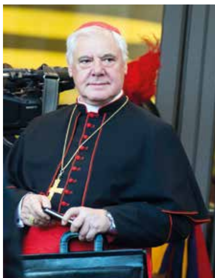
Gerhard kardinál Müller.

Zastánci tohoto přístupu tvrdí, že pomůže vyřešit strádání některých protestantských manželských partnerů, kteří nemohou přijímat eucharistii se svým katolickým manželem či manželkou. Kri-