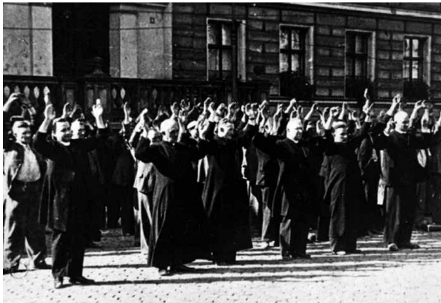
Veřejná poprava polských kněží a civilistů.

pane prokurátore, to jsme se přece naučili od vás.“ Tato skutečnost je dostatečně známá a byla mnohokrát publikovaná. Rosenberg věděl, o čem mluví. Pocházel z estonského Talinu a studoval v Moskvě už za komunistické vlády, poznal proto bolševické metody teroru přímo „od pramene“. Perzekuce křesťanů k nim patřila od samého začátku.