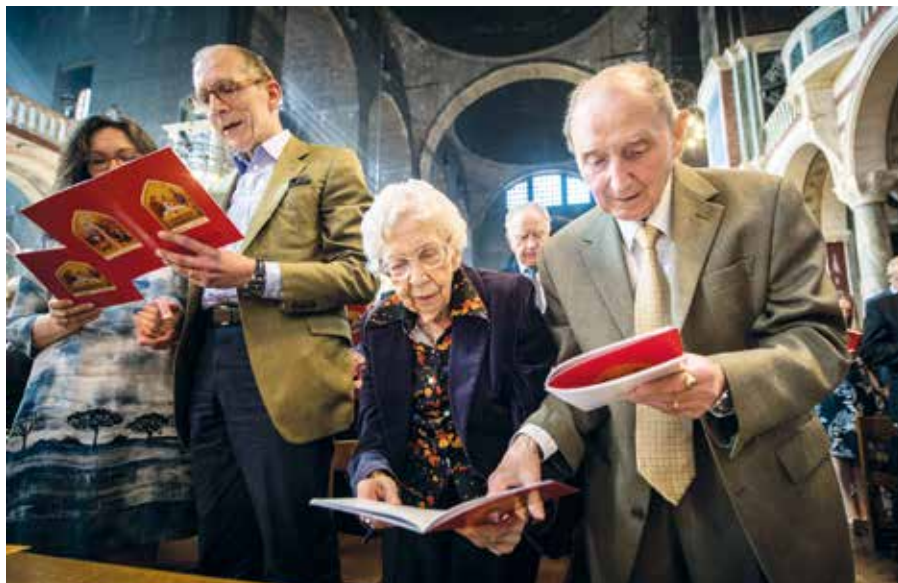
Mše svatá na poděkování za manželství.

advokátů v diskusi o dohodě užívané na TWU přirovnávali odpor k homosexuálním „manželstvím“ k rasismu. Například jeden ontarijský člen vedení komory řekl, že „můžeme učinit účelnou analogii mezi postoji veřejnosti ke vztahům mezi příslušníky různých ras a mezirasovým manželstvím v roce 1985 a diskriminací na základě sexuální orientace v roce 2014.“ V Britské Kolumbii to jeden z předních právníků vyjádřil takto: „V žádném případě se nemůžeme vyhnout otázce... co by tato advokátní komora udělala, kdyby se taková dohoda týkala mezirasových manželství, i kdyby tato zásada vycházela z náboženství, jako tomu bylo v případě Univerzity Boba Jonese.“