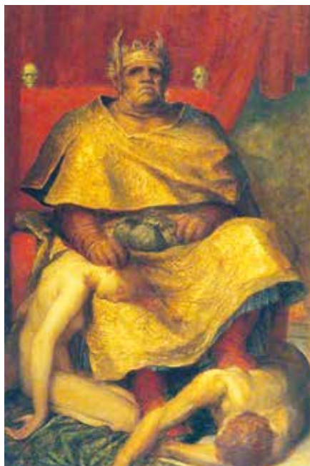
George Frederic Watts: Mamon (1885)

Dvě ženy z Arizony chtěly žalovat diecézi Tucson za to, že kněz měl zprznit jejich dva bratry, kteří potom zprznili své sestry. V Kentucky chtěla tanečnice strip-