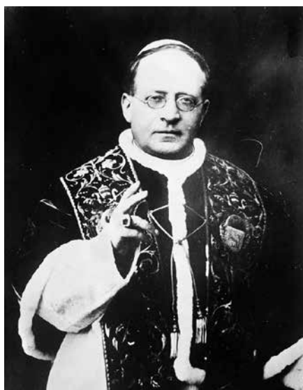
Pius XI.

Plán nacistů zlikvidovat Církev se plně shodoval s plánem sovětských bolševiků, zednářů a dalších nepřátel Kristovy nauky. Proto Církev od prvopočátku existence nacionálně socialistického hnutí v Německu v něm viděla svého nepřítel na stejné úrovni s komunismem, jak o tom svědčí řada vyjádření biskupů i Svatého stolce. Německy psaná encyklika papeže Pia XI. Mit brennender Sorge z roku 1937, kategoricky odsuzující nacismus jako „novopohanství“, představuje vrchol tohoto střetu katolické církve s Hitlerovým režimem. Na ni poté nava-