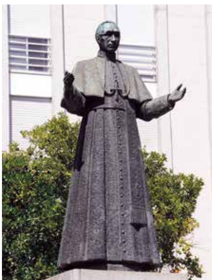
Socha Pia XII. v Braze.

Ohrožení přichází z jiné strany – a nejedná se pouze o recidivu nacistické totality, ale jakékoliv antihumánní diktatury. Arcibiskup polské Poznaně mons. Stanislaw Gadecki v nedávném kázání mluvil o reálném nebezpečí „měkké verze totalitarismu“. Tu už v Evropě máme. Každá totalita, ať už „měkká“ či „tvrdá“, se pozná tak, že prohlašuje za legální to, co je v diametrálním rozporu s přirozeným mravním řádem a lidskou normalitou. Jestliže dnes je téměř v celé Evropě uzákoněno „právo“ ženy zabíjet nenarozené dítě, jestliže homosexuální vztahy jsou postaveny na roveň řádnému heterosexuálnímu manželství, jestliže děti už v mateřské škole jsou indoktrinovány nemorální a protipřirozenou tzv. sexuální výchovou, jestliže ti, kteří mají odvahu se proti těmto zvrženostem ve jménu křesťanských a obecně lidských