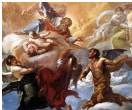
Corrado Giaquinto: Satan před Bohem (1750)

nejslavnějšího díla křesťanské literatury potká v osmém kruhu pekla papeže Mikuláše III., jenž vězí do půl těla hlavou v zemi, neboť se dopouštěl svatokupectví. Podobná muka v odporném podsvětním žlebu prý čekají také na Dantovy papežské současníky Bonifáce VIII. a Kle-