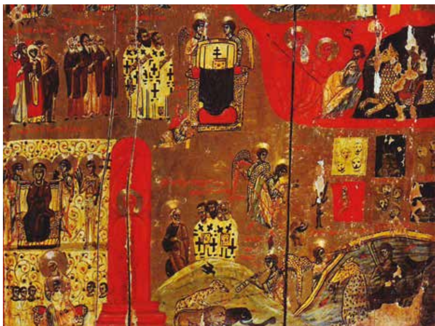
Poslední soud, detail (Sínaj, 12. století).

Mons. Vígano se věnuje především případu bývalého washingtonského arcibiskupa kardinála Theodora Edgara McCarricka, důvěrného poradce papeže Františka.