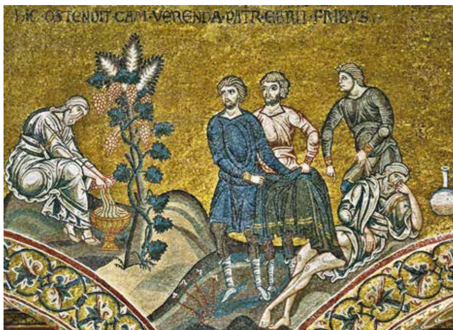
Opilý Noe (Monreale, 12.–13. stol.).

Argumentum ad Noemum je výsostným příkladem onoho klerikalismu, před nímž František tak často varuje. Není