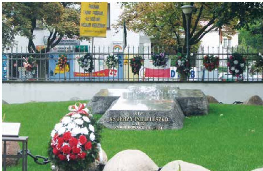
Hrob Jerzyho Popiełuszka.

ků. S měnící se situací v Polsku začátkem 80. let a nárůstem aktivit Solidarity se začal zabývat také pastorační dělníky.