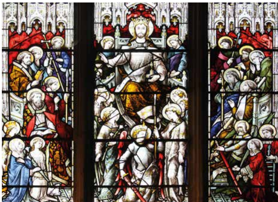
Kristus, král národů.

Homilie papeže Františka při mši svaté v Temuco v Chile