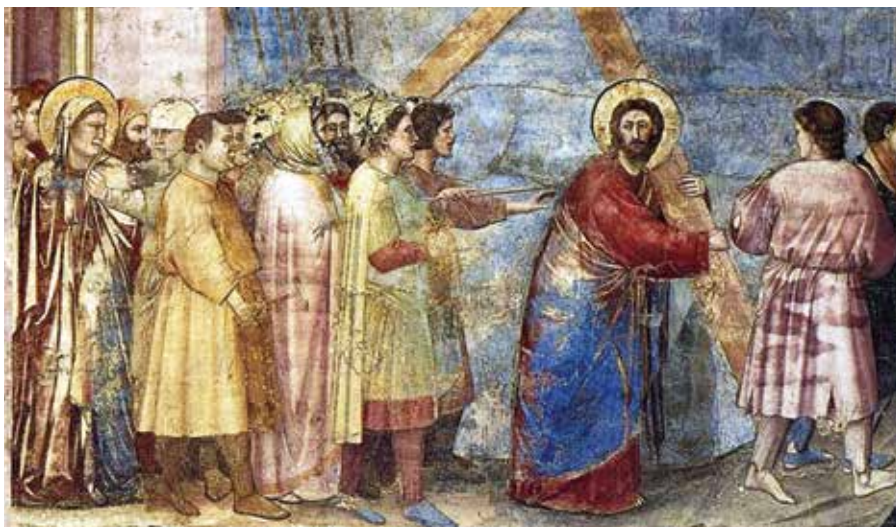
Giotto di Bondone: Cesta na Kalvárii, detail (1304–1306).

byli všichni kromě čtyř posledních mrtví; pouze Kolbe zůstal při vědomí. Poté jim byla podána smrtící injekce fenolu, a i Kolbe zemřel. Datum? 14. srpna 1941, vigilie slavnosti Nanebevzetí Panny Marie, Ženy oděné sluncem a hvězdami, která dávno předtím slíbila mladému Maximilianovi dvě koruny – čistoty a mučednictví.