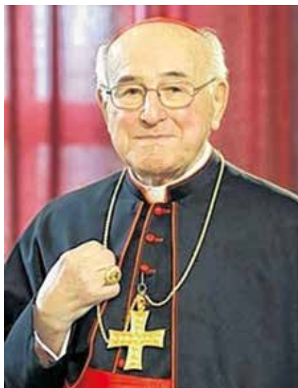
Walter kardinál Brandmüller

O jaký předsudek se tu jedná? Znamená to sněti Lutherovy exkomunikace post mortem? Bude Luther nyní prohlášen „učitelem autentické reformy“? Byla reformace okamžikem „působení Ducha Svatého“, jak řekl jeden zástupce italské