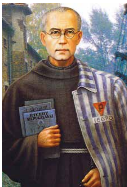
Svatý Maximilián Maria Kolbe

Do Polska jsme dorazili časně ráno, autobus nás přes noc přivezl nejprve do Čenstochové, kde unavené poutníky již více než šest set let vítá Černá Madona, nejposvátnější polská ikona. Přibližně čtyři miliony poutníků ročně přichází, aby hledaly útěchu u nejmocnější polské Královny Matky. Její původ sahá až do doby svatého Lukáše evangelisty, jenž tento obraz údajně namaloval na cedrovou desku stolu vytvořeného samotným Kristem. Opakovaně přiměla nepřátele k útěku, naposledy v minulém století, kdy se sovětská armáda chystala dobýt Varšavu, ale její postup byl zastaven náhlým zjevením Panny Marie nad mraky. Jistě se jednalo o znamení definitivního rozpadu komunismu, ohlášeného poté tím nejdramatičtějším způsobem – historickou návštěvou samotného polského papeže Jana Pavla II. roku 1979.