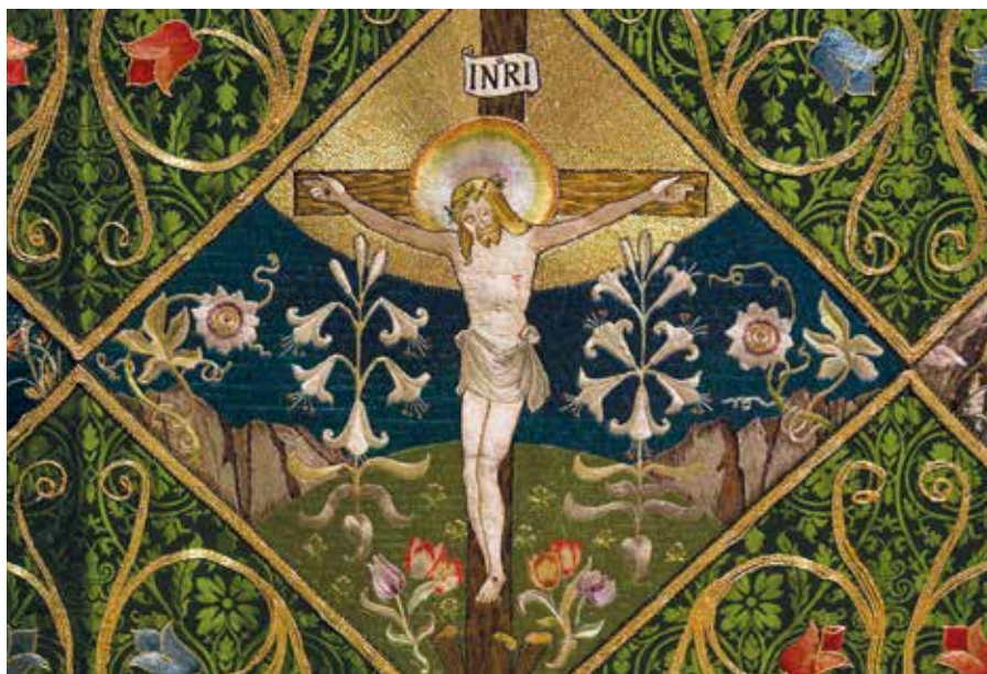
Strom života.

Smysl je přece jasný: Všichni, kdo mají prvotiny Ducha, sténají v očekávání, že budou přijati za vlastní. A toto přijetí je vykoupením celého těla, až jako Boží děti díky přijetí za vlastní tvář v tvář uvidíme ono božské a věčné dobro. V Církvi Páně už toto přijetí za syny existuje, když Duch volá Abba, Otče , jak stojí v listě Galatánům. Ale bude dovršeno, až vstanou všichni do nepomíjitelosti, cti a slávy a budou smět patřit na Boží tvář.