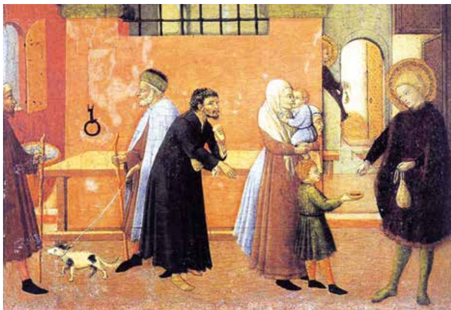
Mistr z Ossevanzy: Svatý Antonín rozdává majetek chudým (1435).

Nikdo by si neměl myslet, že tato příkázání nelze plnit. On zná lépe než kdokoli jiný přirozenost věcí a ví, že divokost se překonává nikoli divokostí, nýbrž mírností.