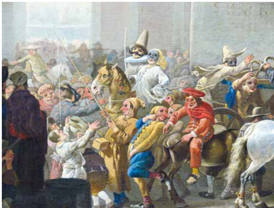
Johannes Lingelbach: Karneval v Římě (1650).

Jednou z příčin, proč lidé ztrácejí osobní integritu, je zbabělost. Strach před veřejným míněním anebo před tím, co si pomyslí například šéf, jej povede k vytvoření nepravdivé prezentace (podoby) sebe samého. V důsledku bude