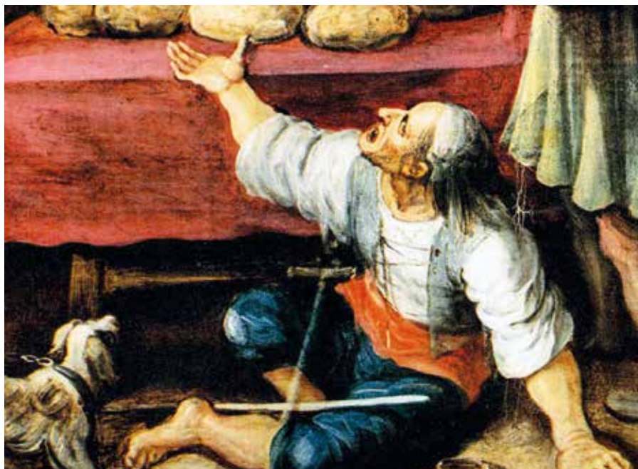
Frans Francken mladší: Sedm skutků milosrdenství (detail, 17. stol.). Foto: Wikimedia Commons

Katolická teologie zná pojem „řád lásky“ – ordo amoris . Církevní učitel Órigenés varuje před nástrahami bezuzdné lásky: „Dokonce i láska není bez nebezpečí – může se stát bezuzdnou. Ten, kdo někoho miluje, nesmí ztratit povahu a motivy lásky ze zřetele a neměl by partnera milovat více, než si zasluhuje... Otěže lásky je třeba držet pevně v rukou a nesmí se jí povolit, aby vybočovala a náhle někoho svrhla do propasti“ (Órigenés, Homilien zum Lukasevangelium , 25,1 und 6; FC 4/1, 269; 273). Órigenés rozlišuje u člověka dvě základní formy lásky – lásku k Bohu a lásku k bližnímu. Láska k Bohu nemá žádné hranice